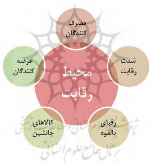
شکل شماره ۲. مدل پورتر برای پویا محیط رقابت

با در نظر گرفتن سازمان‌های رسانه‌ای- از جمله سازمان صدا و سیما جمهوری اسلامی ایران- به‌عنوان عرضه‌کنندگان در محیط رقابت رسانه‌ای و تعریف کردن مخاطبان بالقوه صدا و سیما- به‌عنوان خریداران و مصرف‌کنندگان- از مدل پورتر برای تحلیل محیط رقابت در فضای رسانه‌ای کشور استفاده خواهیم کرد و تلاش می‌کنیم براساس پنج مؤلفه پیشنهادی پورتر، مجموعه عوامل و عناصر مؤثر بر آینده فعالیت سازمان صدا و سیما در فضای مجازی را شناسایی کنیم (شکل ۲).