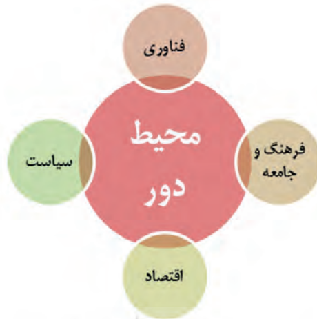
شکل شماره ۱. مدل PEST برای پویش محیط دور