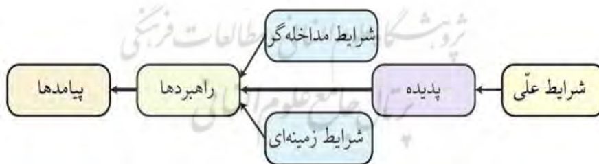
نمودار شماره ۱: عناصر اصلی پارادایم در کدگذاری محوری

مرحله اول یعنی کدگذاری باز، ابتدا مصاحبه‌ها به صورت سطر به سطر بررسی شدند و مفاهیم اصلی و ابعاد مرتبط با موضوع تعیین و مشخص شدند. کدهای ایجاد شده در این مرحله با عنوان کدهای توصیفی شناخته می‌شوند. یعنی کدهایی که اساساً برای توصیف داده‌های حاصل از مصاحبه مطرح شده‌اند و هنوز دارای قدرت تبیین پدیده مورد نظر نیستند. در این مرحله با تحلیل مصاحبه‌ها ۳۵۵ کد باز به دست آمد که به صورت طیف-های مفهومی اولیه مشخص شدند. در مرحله دوم یعنی کدگذاری محوری کدهای اولیه براساس شباهت و تفاوت با سایر کدها مقوله‌ها دسته بندی شدند. یعنی موارد مشابه با هم ادغام شده و با سایر کدها در یک مقوله مشترک قرار گرفتند. در این مرحله یکی از مقوله‌های کدگذاری باز انتخاب شده و سایر مقوله‌ها با آن ارتباط یافتند. پس از مشخص نمودن کدهای محوری، فرایند کدگذاری انتخابی یعنی مشخص شدن ارتباط بین این مقوله‌ها انجام شد. در این مرحله به منظور طراحی الگوی پارادایمی یکی از مقوله‌ها که در اینجا تحت عنوان مدل بالندگی رهبری معنوی است به عنوان مقوله اصلی در نظر گرفته شده است و ارتباط با سایر مقوله‌ها با آن تعیین شد. در طراحی پارادایم مورد نظر شش بعد اصلی بدین صورت تبیین شد: شرایط علی: شرایط اصلی را تحت تأثیر قرار می‌دهد، شرایط زمینه‌ای: شرایط ویژه‌ای که بر راهبردها تأثیرگذار است، مقوله هسته‌ای: پدیده اصلی مورد بررسی است، شرایط مداخله‌گر: شرایط عمومی تأثیرگذار بر راهبرد می‌باشد، راهبردها: اقدامات یا تعاملاتی که از پدیده اصلی بدست می‌آیند، پیامدها: نتایجی که از راهبردها حاصل می‌گردد (صلاحی، ۱۳۹۶).