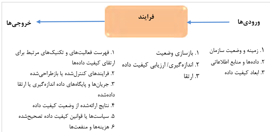
شکل ۲. نتایج حاصل از فراترکیب