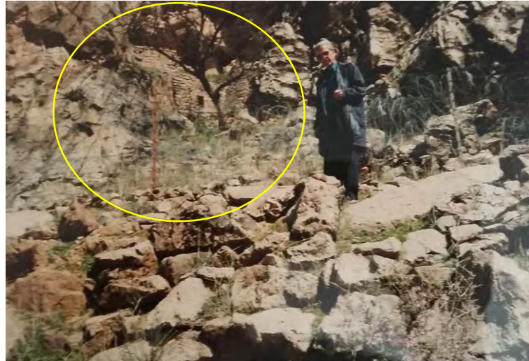
تصویر ۵: موقعیت دو حلقه چاه قبل از سیم خاردار نسبت به معبد (نگارنده، ۱۳۷۹)

ولی از آن جا که در این معبد، آثاری از هیچ گونه قبری وجود ندارد و تاکنون هم از هیچ فردی در این مورد گزارش نشده با بررسی‌های میدانی و مصاحبه‌های متعدد با درویش کهنسال و تحقیق از گوران‌های مقیم منطقه چنین معلوم شد، پیش از آن که ارتش در دهه‌ی ۳۰ به علت نیاز راهبردی اقدام به تصرف نماید، آن مکان جمخانه درویش بوده است. به هرحال این معبد در دو طبقه و به سبک معماری شهر ماسوله و بعضی از شهرهای لرستان و کردستان که گذرگاه‌های عمومی و یا حیاط و محوطه‌ی طبقه فوقانی روی سقف طبقه‌ی تحتانی قرار دارد، ساخته شده است. برای رسیدن به طبقه‌ی بالا، پله‌هایی وجود داشته که به علی در آن جایجا شده و تخریب گردیده است.