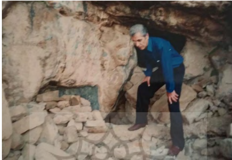
تصویر ۹: نمازخانه و مهرابه و سقف فروریخته‌ی طبقه زیرین (نگارنده، ۱۳۷۹).

سمت راست سکو و مجاور ورودی غار تاقچه‌ای مستطیل شکل کنده شده احتمالاً محل قرار دادن شمع یا وسیله روشنایی بوده است و در بیرون نیز سمت چپ مجاور دهانه‌ی غار، تاقچه‌ای کنده شده که از مقابل به شکل مستطیل ولی از کف به شکل دوزنقه است شاید محلی برای وضوع گرفتن (مهراب) قبل از ورود به غار (نمازخانه) باشد (تصاویر ۹ و ۱۰).