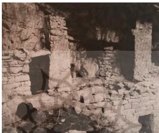
تصویر ۷: نمای شرقی نمازخانه و دریچه‌ی ورود به طبقه پایین، قبل از تخریب (منبع: ایزدپناه، ۱۳۵۵)

در طبقه‌ی فوقانی کمی عقب‌تر از سقف طبقه‌ی زیرین که ریخته شده است، دو پایه بلند (شمالی و جنوبی) سنگ‌چین به ارتفاع تقریبی سه متر و به قطر ۸۰ سانتیمتر با حالتی مشابه دیوار که از سه طرف (مقابل و جوانب) آزاد و از اطراف چهارم چسبیده به صخره تا زیر پیش‌آمدگی کوه که همانند سایه‌بان است کشیده شده (این پیش‌آمدگی حالت سقفی برای این دو پایه دارد). در انتهای فضای بین این دو پایه قطور (بر سینۀ کوه) دخمه طبیعی و شبیه به غار کوچکی وجود دارد که احتمالاً نمازخانه معبد بوده است. ورودی آن با دستکاری و کنده‌کاری تقریباً به شکل پا چلاقی (مربع چسبیده به مستطیل) درآمده است. دهانه‌ی ورودی غار رو به خورشید (خاور) است (تصویر ۸). در سمت راست معبد (ضلع شمال شرقی) چسبیده به کوه اطاقی وجود داشته که متأسفانه ریخته و یا تخریب شده است (تصاویر ۸ و ۷ مقایسه شود).