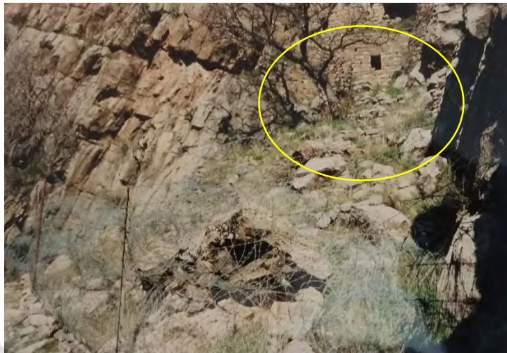
تصویر ۳: نمای شرقی معبد در میان شیار کوه (نگارنده، ۱۳۷۹)

در ارتفاع ۵۰-۶۰ متری از سطح گورستان، در درون این شیار، معبدی قرار دارد که در اذهان عمومی به «مقبره باباعباس» معروفیت دارد. (تصاویر ۳-۴-۵-۶).