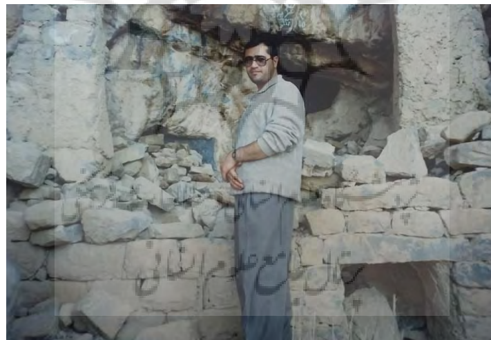
تصویر ۱۰: نمای از نمازخانه و مهرابه

در طبقه‌ی زیرین که گفته شد سقف (پشت بام) آن‌ها محوطه و یا حیاط طبقه‌ی بالا (معبد) است دو اطاق مجزاً از هم وجود دارد که سقف آن‌ها مسطح بوده و ریخته شده است. یکی از اطاق‌ها در مقابل معبد است. (تصاویر ۱۲ و ۱۱ و ۱۰ و ۹) مکعبی شکل و به ابعاد تقریبی ۱/۵ \times ۱/۵ \times ۱/۵ متر و دارای دریچه ورود و خروج و مشرف به آفتاب و به ابعاد ۸۰ \times ۶۰ سانتیمتر و اطاق دوم که ورودی آن از طبقه‌ی بالا است (دخمه‌ی چسبیده به پایه جنوبی چپ معبد، تصاویر ۸ و ۷). کمی بزرگتر از اطاق مجاور به شکل مکعب مستطیل و به ابعاد ۳/۵ \times ۲ متر با گودی بیشتر از اطاق اولی و با دو دریچه جهت