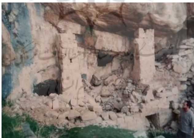
تصویر ۸: نمای شرقی نمازخانه و دریچه‌ی ورود به طبقه پایین، بعد از تخریب

فضای داخلی غار تقریباً مربع نامنظم و به ابعاد ۲×۲ متر می‌باشد. در کف آن حوضچه ماندنی کم عمق کنده شده که شاید مکان نشستن و یا حلقه زدن افراد به دور همدیگر بوده است. در قسمت انتهایی این غار در بدنه‌ی کوه دو سکوی کوچک شبیه به پله، رو به دهانه‌ی غار حجاری شده که احتمالاً مکان جلوس پیر (به سمت خورشید) باشد.