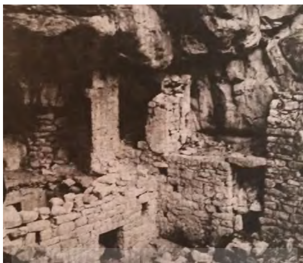
تصویر ۱۱: نمای طبقه‌ی زیرین معبد قبل از تخریب (شادروان حمید ایزدپناه)

تامین روشنایی که به لحاظ اختصاصی بودن راه ورودی، شاید از این اطاق برای نگهداری نذوراتی که مردم به پیر و معبد نیاز می‌کرده‌اند استفاده می‌شده است.