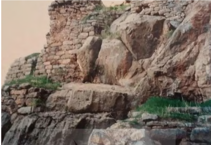
تصویر ۱۳: نمای شرقی قربانگاه از نزدیک (نگارنده، ۱۳۷۹)