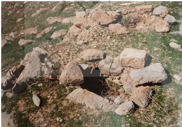
تصویر ۱۴: دو حلقه چاه آب حفر شده در پایین معبد (نگارنده، ۱۳۷۹)