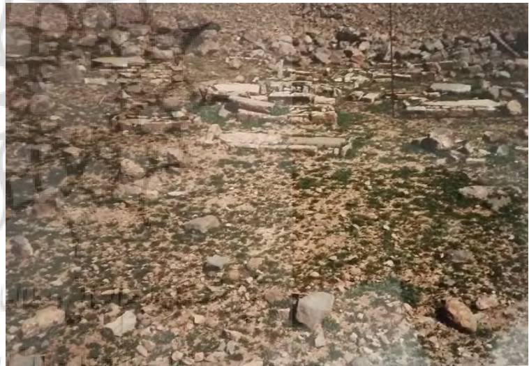
تصویر ۲: گورستان کاملاً زنانه مجاور سفید کوه (نگارنده: ۱۳۷۹).

به فاصله ۷۰-۸۰ متری از گورستان بلافاصله شیب تند و ناگهانی کوه شروع می‌شود و در سینه‌کش این کوه مجاور گورستان، یک شیار مثلثی شکل وجود دارد که برخلاف معنی «دره»، دره بواَس نامیده شده است. از سه ضلع این شیار، دو ضلع آن چسبیده به کوه که رأس مثلث در دل صخره‌ها جای دارد و ضلع سوم یعنی قاعده، مشرف به گورستان و محوطه باباعباس است. (تصویر ۲)