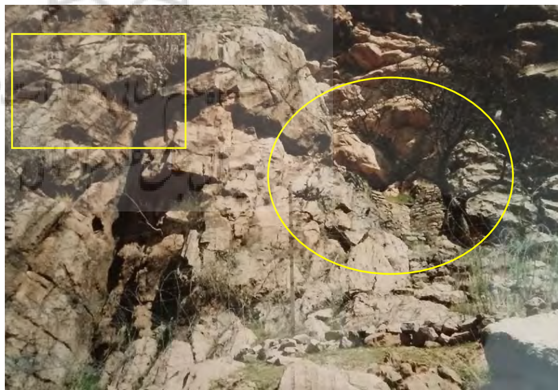
تصویر ۶: نمای جنوبی معبد و قربانگاه

ولی از آن جا که در این معبد، آثاری از هیچ گونه قبری وجود ندارد و تاکنون هم از هیچ فردی در این مورد گزارش نشده با بررسی‌های میدانی و مصاحبه‌های متعدد با درویش کهنسال و تحقیق از گوران‌های مقیم منطقه چنین معلوم شد، پیش از آن که ارتش در دهه‌ی ۳۰ به علت نیاز راهبردی اقدام به تصرف نماید، آن مکان جمخانه درویش بوده است. به هرحال این معبد در دو طبقه و به سبک معماری شهر ماسوله و بعضی از شهرهای لرستان و کردستان که گذرگاه‌های عمومی و یا حیاط و محوطه‌ی طبقه فوقانی روی سقف طبقه‌ی تحتانی قرار دارد، ساخته شده است. برای رسیدن به طبقه‌ی بالا، پله‌هایی وجود داشته که به علی در آن جایجا شده و تخریب گردیده است.