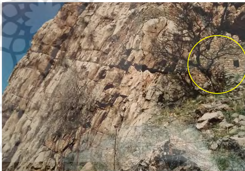
تصویر ۴: نمای معبد و موقیت آن نسبت به قربانگاه (نگاره، ۱۳۷۹).