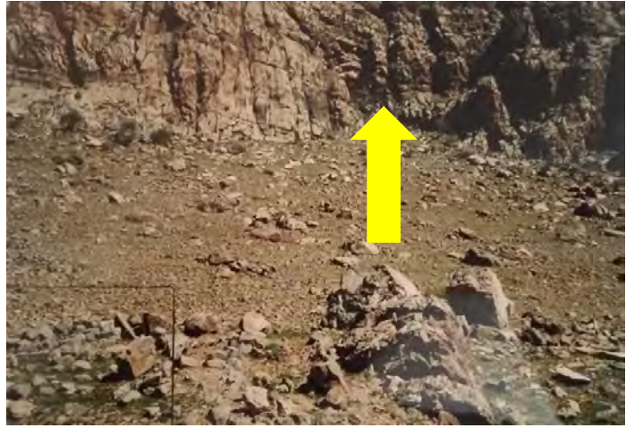
تصویر ۱: شیب دامنه‌ی سفید کوه. در شیار بین دو کوه معبد واقع شده است.