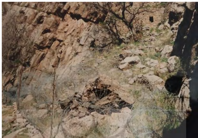
تصویر ۱۵: نمای شرقی معبد.

به فاصله تقریبی ۴۰-۵۰ متری پایین معبد و در کنار سیم خاردارهای کشیده شده جهت حراست، دو حلقه چاه با فاصله کمی از یکدیگر حفر شده که اطراف و دیوارهای جانبی آن سنگ چین شده است و بعلت پر شدن از خاک و خاشاک، عمق آن‌ها نامشخص است (تصاویر ۱۵ و ۱۶).