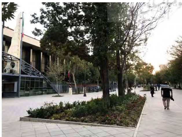
تصویر ۳. نمایی از گذر شهریار، تهران. عکس: مریم مجیدی، ۱۳۹۹.

این پژوهش از دو بخش اصلی تشکیل شد. بخش اول که به بررسی ادبیات مشارکت اختصاص داشت نشان داد صفت اصلی مشارکت، «مردم‌محور» بودن آن است و در مورد هر چیزی که به نوعی شامل مردم باشد استفاده می‌شود. از طرفی بررسی ادبیات منظر نیز نشان داد که یکی از شروط اساسی رویکرد منظر «مخاطب‌محور» بودن آن است. منظر از دید متخصصان و نخبگان تعریف نمی‌شود، بلکه از دید مخاطب تعریف می‌شود. منظور از مخاطب آن مخاطبی است که فعالانه در فرایند فهم و تولید فضا نقشی مؤثر و غیرقابل اجتناب دارد. بنابراین اقبال عمومی در آن از ملزومات است. هنگامی که واکنش و نظر بهره‌بردار به عنوان یکی از شروط ارزیابی منظر قرار بگیرد، به این معناست که منظر قدرت توسعه مشارکت و برقراری یک «مشارکت واقعی» را خواهد داشت. این نوع مشارکت، یک مشارکت تشریفاتی نیست. در سایر رشته‌های طراحی محیط همچون معماری و شهرسازی نیز از مشارکت صحبت می‌شود اما به‌نظر می‌رسد صحبت از یک نوع «مشارکت اختیاری» است که اگر وجود داشته باشد بهتر است و به افزایش کیفیت محیط کمک می‌کند ولی اگر وجود نداشته باشد ماهیت عمل دچار خدشه نخواهد شد. در صورتی که نوع مشارکت نهفته در مفهوم رویکرد منظر، یک نوع «مشارکت اجباری» است. زیرا در تعریف آن گفته می‌شود که رویکردی است مخاطب‌محور، در نتیجه ارزیابی آن وابسته به نظر مخاطب است. بنابراین وجه