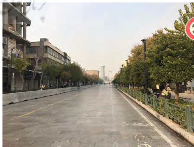
تصویر ۲. پیاده‌راه ۱۷ شهریور تهران که در روزهای عادی حضور مردم در آن بسیار کم است. عکس: مریم مجیدی، ۱۳۹۸.