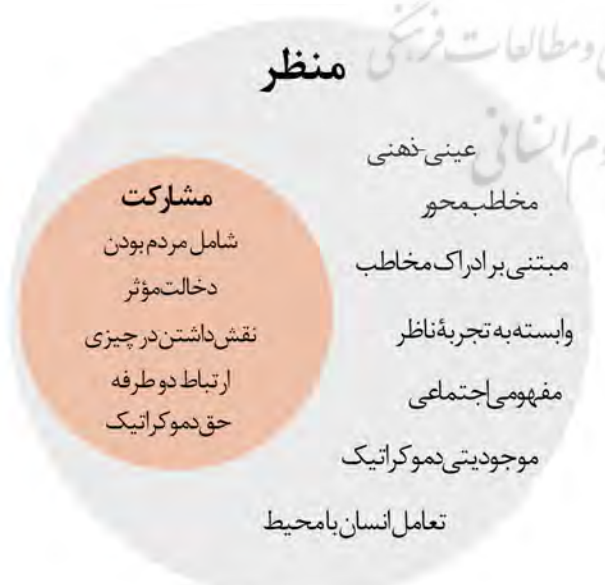
تصویر ۴. مشارکت به عنوان جزئی لاینفک از تعریف منظر و مفهومی در بطن آن.

رویکرد منظرین به دلیل آنکه تعریف خود را از ادراک مخاطب آغاز می‌کند و ذهنیت و ادراک او را جزئی لاینفک از منظر می‌شناسد، می‌تواند تأمین‌کننده حداکثر مشارکت باشد. ملاک قراردادن مخاطب و ذهنیت او به معنای تأمین دیدگاه‌ها و نظرات او خواهد بود و همین مسئله رضایتمندی مخاطب از محیط را به دنبال خواهد داشت. تعریف منظر به دلیل اینکه از ادراک مخاطب نشأت می‌گیرد، تعریفی از پایین به بالاست و همین دیدگاه ارتباط این مفهوم را با مشارکت مشخص می‌کند. بنابراین تعریف منظر نیازمند در نظر گرفتن مخاطب است. ادبیات مشارکت حق تصمیم‌گیری به صورت فردی را نفی می‌کند اما اینکه چه کسی حق تصمیم‌گیری دارد را مشخص نمی‌کند، در حالی که رویکرد منظر می‌تواند پاسخگوی این سؤال باشد. این رویکرد با مشخص کردن جایگاه مخاطب، فضا و محیط را ساخته ذهن او می‌داند. در واقع شناخت ذی‌نفع در رویکرد منظر اتفاق می‌افتد؛ چیزی که حتی بسیاری از متخصصان نیز در شناخت آن دچار مشکل هستند. بنابراین در پاسخ به سؤال اصلی پژوهش که ظرفیت‌های منظر در تحقق مشارکت چیست؟ می‌توان گفت رویکرد منظرین به فضا و محیط. زیرا این رویکرد فضا را از نگاه مخاطب آن ادراک می‌کند، پس به‌طور ذاتی مفهوم مشارکت را در خود داشته و اساساً هرگونه تعریف دیگری از آن در صورت نادیده گرفتن مخاطب، تعریف خود منظر و رویکرد منظرین را دچار اختلال خواهد کرد. در نتیجه منظر بدون مشارکت مخاطب و ذهن او بی‌معنا بوده و در تعارض با معنای منظر است و حتی می‌توان گفت منظر چیزی به غیر از مشارکت مخاطب نیست. بنابراین مهمترین و اصلی‌ترین ظرفیت آن، توجه به ذهن و ادراک مخاطب است.