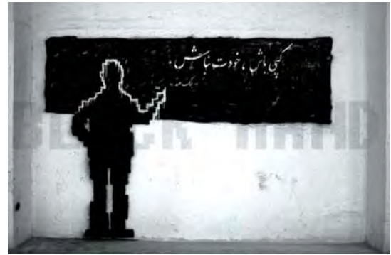
تصویر ۶. پیش متن؛ گرافیتی اثر بلک هند.

فورژری؛ پاستیشی به تمام معناست که با تقلید از سبک پیش متن، در قالبی مشخص، امکان تداوم و ادامه آن را فراهم می کند. ساختار این گونه جدی است. قلمدار از هنرمندان گرافیتی کاری است که با الهام از نگارگری و خوشنویسی ایرانی و تاثیر از جنبش سقاخانه ای به ویژه آثار فرامرز