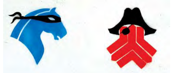
تصویر ۲۰. گرافیتی اهالی سرگردنه، بیش متن تصویر ۲۱.