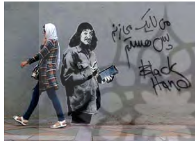
تصویر ۱۶. گرافیتی بلک هند.