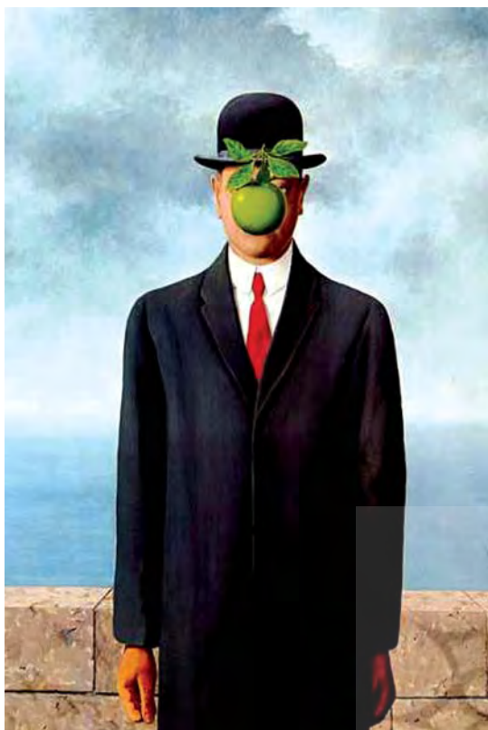
تصویر ۴. تابلوی پسر انسان، اثر رنه مگریت.