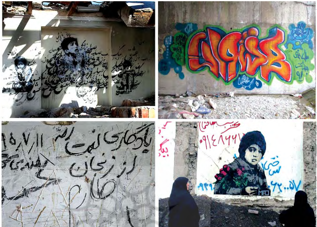
تصویر ۱. نمونه گرافیتی ایرانی.

اقلیت تبدیل شد. "از گرافیتی به منزله شیوه ای برای ارسال پیام های اجتماعی و سیاسی و شکلی از تبلیغات استفاده می شود. همچنین چوگان شکل هنری مدرنی شناخته شده که اکنون در سراسر دنیا در گالری ها به نمایش در می آید" (کوثری، ۱۳۸۹، ۶۸).