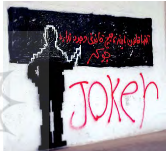
تصویر ۷. پیش متن؛ گرافیتی اثر جوکر.