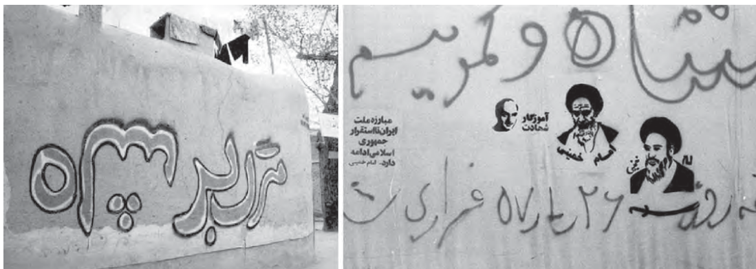
تصویر ۲. گرافیتی های دوران انقلاب.