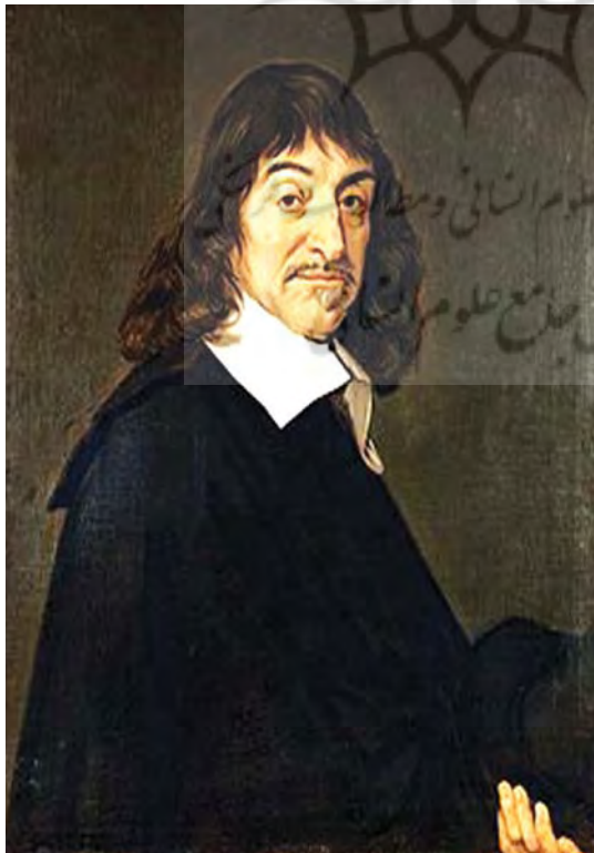
تصویر ۱۷. پرتره رنه دکارت اثر فرانس هالس.

قرمز رنگ در اطراف، کارگری که بیل را بر شانه اش حمل می کند و به نشانه نارضایتی از اوضاع در حال ترک کار و خروج از کادر تابلو است، همچنین پیام نوشتاری هنرمند و امضای او در مرکزی ترین نقطه ترکیب بندی عناصر بصری گرافیتی ژئو را تشکیل می دهند.