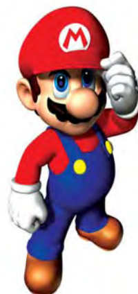
تصویر ۲۶. پیش‌متن گرافیتی‌های تصاویر ۲۴ و ۲۵.

عموم قرار داده است. نمونه دیگر از بیش‌متنیت اقتباسی تصاویر ۲۴ و ۲۵ است. بر اساس آن گرافر با بهره‌گیری از شخصیت‌های بازی یارانه ای معروف "ماریو"، تصویر تلویزیون و همچنین آدمک‌های تجریدی که به هیبت انسان‌های اولیه در حال شکار ترسیم شده‌اند و تقلیدی تراگونه از نقاشی‌های پناهگاهی پیش از تاریخ می‌باشند، اثر خود را خلق کرده است. جایگشت هنرمندانه انیمیشن و سنگ‌نگاره‌ها در بیش‌متنی گرافیتی مهارت خالق آن را در هشدار به اثرات مخرب تکنولوژی نشان می‌دهد. ژنو با گرافیتی خود اشاره ای ظریف به اسارت انسان معاصر در بند دنیای مجازی و مظاهر مدرنیته داشته که لازم است چون گذشته به مقابله با دشمن برخیزد و روح آن را به تسخیر خویش درآورد.