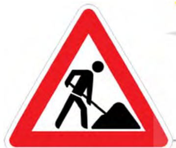
تصویر ۱۳. پیکتوگرام کارگران مشغول کارند.

پیلارام و حسین زنده رودی مجموعه کالیگرافیتی‌هایی خلق کرده که در قالبی مشخص ادامه دار شده اند (نک. زرکار، ۲۰۱۴). همچنین تصویری ۱۱ اثری را نشان می‌دهد که ضمن برگرفتگی از تصویر نظریه معروف تکامل چارلز داروین، با تکرار و تداوم در آثار گرافیتی ایرانی ادامه یافتند و هر گرافری متناسب با دیدگاه مورد نظر خود از این تصویر در اثرش استفاده کرده است. تکثیر این بیش‌متن در ساختاری یکسان با پیش‌متن و کارکردی جدی صورت پذیرفته است.