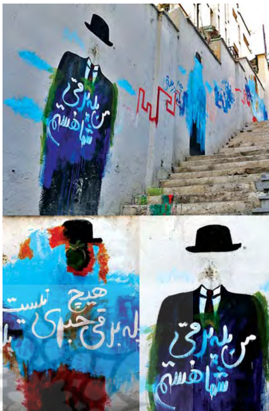
تصویر ۳. گرافیتی، بیش متن از گونه پاستیش.