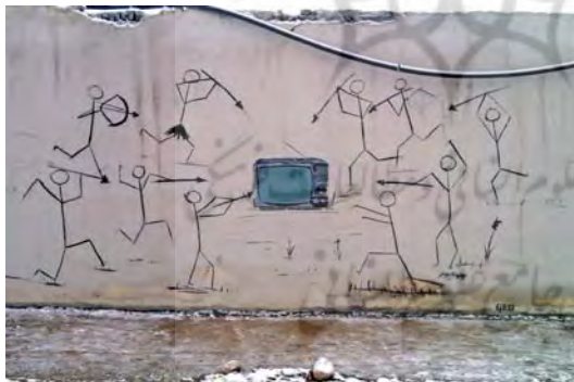
تصاویر ۲۴ و ۲۵. بیش متن گرافیتی از گونه ترانسپوزیسیون.