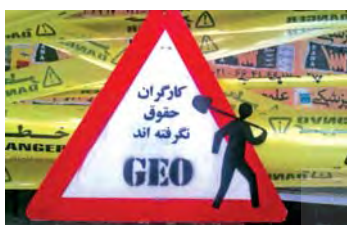
تصویر ۱۲. بیش‌متن تصویر ۱۳. گرافیتی کارگران حقوق نگرفته اند. مأخذ: www.irangraffiti.com .