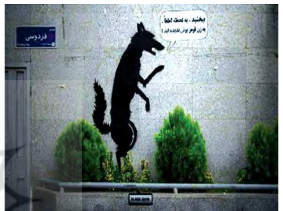
تصویر ۲۲. گرافیتی بلک هند، بیش متنی از گونه ترانسپوزیسیون.