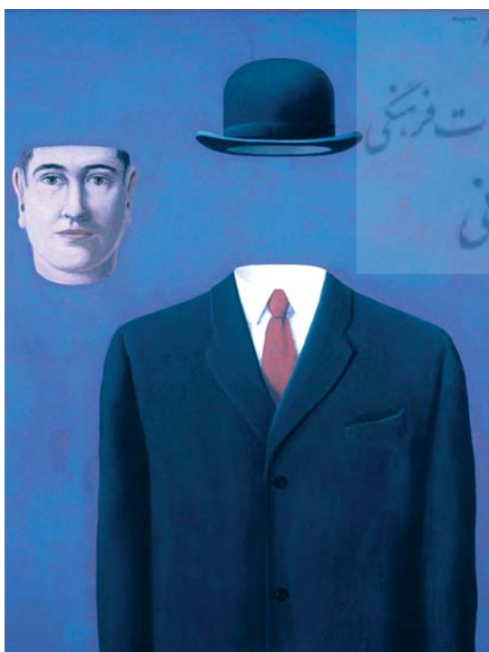
تصویر ۵. تابلوی زائر، اثر رنه مگریت.

بیش متنی وضع کرده در پیکره های مطالعاتی این مقاله واکاوی می شوند. با توجه به آنچه گفته شد آثار گرافیتی زیر شرایط لازم را برای مطالعه بیش متنی دارا هستند و تنها اثبات برگرفتی از پیش متن را می طلبند که در سطور آتی با اشاره به اشتقاقات و تاثرات هر اثر گرافیتی از پیش متن خود، به مطالعه روابط بیش متنی آنها می پردازیم و در آخر ویژگی های این روابط را در جداول مربوطه مرور می کنیم.