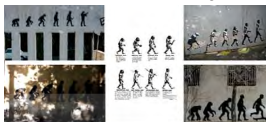
تصویر ۱۱. بیش‌متن‌هایی از نوع فورژری برای پیش‌متن تصویری نظریه تکامل داروین.