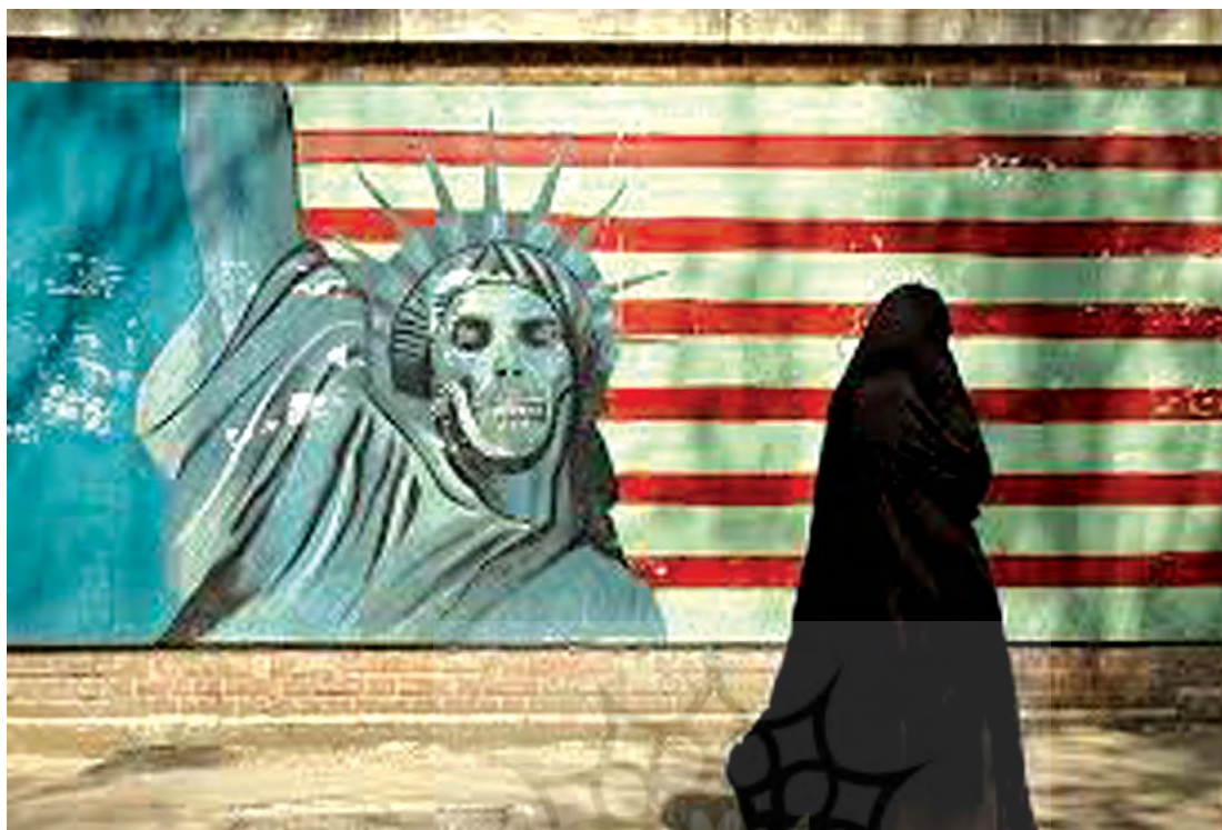
تصویر ۱۸. گرافیتی، بیش متن از گونه تراوستیسمان. مأخذ: www.parsine.com .