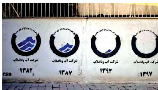
تصویر ۹. بیش‌متن؛ گرافیتی اثر Geo.