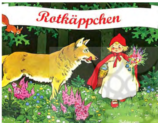
تصویر ۲۳. یکی از پیش متن های گرافیتی تصویر ۲۲.