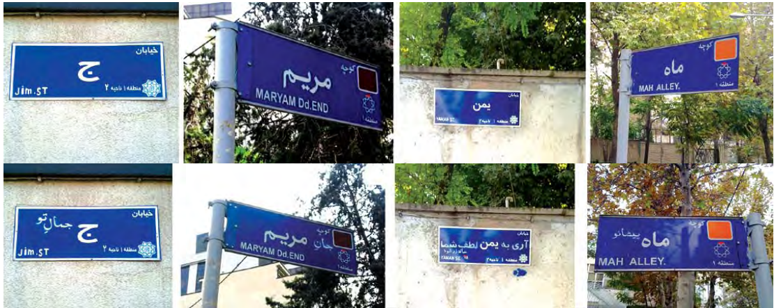
تصویر ۱۴ (ردیف بالا). پیش متن تصویر ۱۵. مأخذ: www.daydreamer.blog.ir . تصویر ۱۵ (ردیف پایین). گرافیتی؛ بیش متن از نوع پارودی. مأخذ: همان.