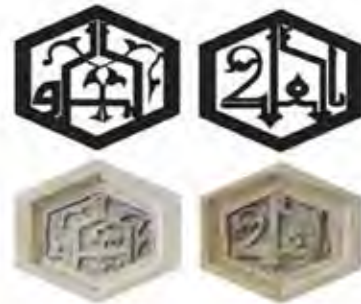
تصویر ۱۳- سردر ورودی بقعه موید بن المسافر.

در زیر کتیبه سردر ورودی بقعه موید بن المسافر (تصاویر ۱۳ و ۱۴)، کلمات «الملک» و «الله» در یک فضای هندسی شش ضلعی می باشند.