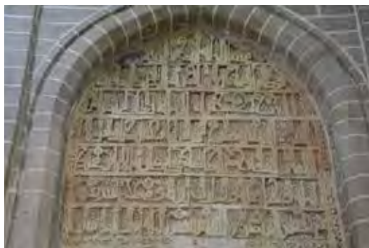
تصویر ۲- نمونه‌ای از کتیبه کوفی موجود در امامزاده عبدالله شوشتر (نگارندگان).

غیر معین صورت می‌گیرد؛ ستون‌ها، طاق‌ها، سلول‌های کندوی سقف (مقرنس) و به‌خصوص، اشکال گوناگون تزیینات کاربردی گل و گیاهی، هندسی و کتیبه‌ای. این‌که استادکاری که این تزیینات را پدید آورد از درهم آمیختن رنگ‌ها، مواد، بافت‌ها و درون مایه‌های طرح‌ها واقعا لذت می‌برده، چندان مورد بحث نیست؛ لکن تزیینات اسلامی مفهومی بیش از این دارند. هر کدام از این سه گروه ذکر شده گل و گیاهی، هندسی و کتیبه‌ای ابعاد عمیق‌تری دارند» (هیلن براند، ۱۳۸۶: ۱۶۸).