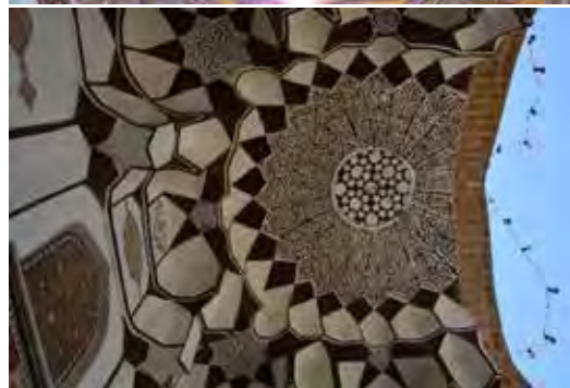
تصویر ۱- نمونه‌ای از تزیینات سردر ورودی امامزاده عبدالله شوشتر (نگارندگان).