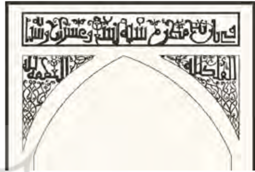
تصویر ۱۲- بازسازی قسمت پایین سردر ورودی (نگارندگان).

قسمت پایینی کتیبه کوفی سردر ورودی امامزاده عبدالله در این قسمت کتیبه ای وجود دارد که به تاریخ (فی تاریخ محرم سنه تسع و عشرين و ستمائه) قرن هفتم هجری (۶۲۹ ق.ه) اشاره می کند. احتمال می رود سال ساخت بنای کنونی نیز باشد. در زیر آن، دو کلمه «الملک الله» و «العظمه لله» در گوشه راست و چپ گچ بری شده اند. این کتیبه به صورت گچ بری بر روی سردر ورودی اجرا شده است. گچ بری یکی از ویژگی های اجرایی تزیینات در قرن هفتم هجری می باشد.