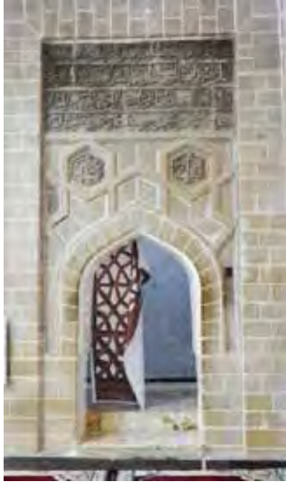
تصویر ۱۴- کلمات (الملک) و (الله) به خط کوفی (نگارندگان).

فضای کلی سردر ورودی مقبره موید بن المسافر طرحی به شکل برجسته دارد و نقوش هندسی آن به حالت قرینه روبه روی هم اجرا شده است. در شش ضلعی های این نقش هندسی به خط کوفی کلمات الله و الملک نوشته شده است. این دو کتیبه به شیوه گچ بری برجسته هستند و در فضای هندسی شش ضلعی طراحی و سامان دهی شده اند. کتیبه الله ، به خط کوفی ساده - که با نقوش اسلیمی در پس زمینه ترکیب شده است - و کتیبه الملک ، به خط کوفی برگردار نوشته شده است. در فضاهای مثبت (نوشته الله ) و فضای منفی (پس زمینه) با همراهی نقوش اسلیمی، هنرمند به ایجاد تعادل در فضای کتیبه دست یافته است. در کتیبه الملک نیز هنرمند با نوشته (الملک) به خط کوفی برگردار در فضای شش ضلعی با حرکت برگ های انتهای حروف به برابری فضای مثبت و منفی در شکل کلی این کتیبه دست یافته است و دارای روابط هماهنگ بین متن کتیبه و زمینه هستند. از نقش و نگار در راستای زیبایی خط استفاده شده است.