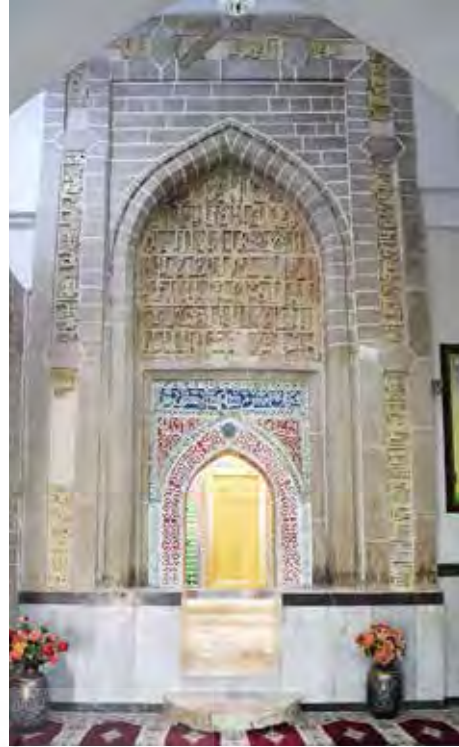
تصویر ۳- سردر ورودی و بازسازی سردر ورودی بقعه امامزاده عبدالله (نگارندگان).