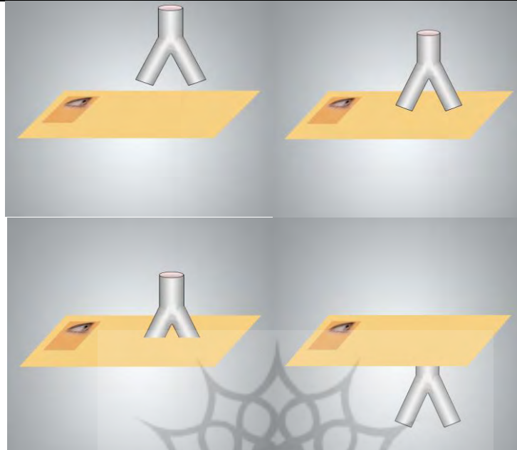
شکل شماره ۲: حرکت دو شاخه از ابتدای ورود به صفحه‌ی دو بعدی تا خروج از آن (ترتیب بر اساس حرکت عقربه‌های ساعت)

در تصویر ارائه شده دو شاخه کوچک ما یک مدل بسیار ساده از عالم چهاربعدی طبیعت است که بر روی سطح طراحی شده یعنی P قرار دارد و ناظر دو بعدی به جای دیدن تیرکمان تنها سطوحی که با سطح P انطباق می‌یابد را درک می‌کند. دو دایره‌ی جدا و گیسخته از هم. به همین جهت آن چه می‌بینید نه دو شاخه‌ی تیر کمان که تنها سطوح دایره‌ای شکل است که گویا با یکدیگر هیچ نحوه ارتباطی ندارند. دایره‌ای که به مرور زمان کوچک‌تر یا بزرگ‌تر، به یکدیگر نزدیک‌تر یا دورتر شده اما در حقیقت این حرکت مجموعه‌ی جهان است که در چارچوب زمان این تغییر شکل و اندازه‌ها را ایجاد کرده و در اصل تمامی این تصاویر قابل مشاهده برای ناظر، دارای یک وحدت شخصی اتصالی است. مسأله‌ی دیگری که باید در این الگو مدنظر قرار داد حرکت، جابه‌جایی و تغییر هر کدام از قسمت‌های این تیرکمان منجر به تغییر و حرکت در شاخه‌ی دیگر شده بدون آن که فرد ناظر در سطح متوجه دلیل تغییرات این دو شود. با این بیان هرگونه تغییری، چه با اختیار و چه بدون اختیار در این عالم ایجاد شود، بی‌شک بر روی یکایک اعضای این مجموعه تأثیرگذار خواهد بود. با توجه به امتداد فضا- زمان در عالم طبیعت و در نهایت ایجاد چهار بعد در این مجموعه، و از آن جا که ترسیم بعد چهارم بر روی کاغذ امری ناشدنی است تصور الگوی مورد نظر را به سه بعد تقلیل داده تا پس از بیان مقصود، مخاطب آن را در چهار بعد تعمیم دهد.