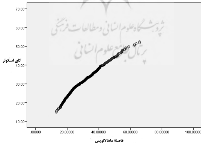
شکل ۱. نمودار فاصله ماهالانویس برای داده‌های پرت چندمتغیره

قبل از انجام تحلیل عاملی تأییدی، آزمون‌های مقدماتی مانند بررسی داده‌های از دست رفته، داده‌های دورافتاده و نرمال بودن داده‌ها انجام شد. داده‌های پرت به وسیله آزمون ماهالانویس دی‌اسکوئر با سطح معناداری ۰/۰۰۱ در نرم‌افزار ایموس مورد بررسی قرار گرفت و ۱۶ داده پرت شناسایی شد زیرا تقسیم عدد ماهالانویس دی‌اسکوئر آن بر تعداد گویه‌های آشکار بزرگ‌تر از عدد چهار بود، از مجموع داده‌ها حذف گردید.