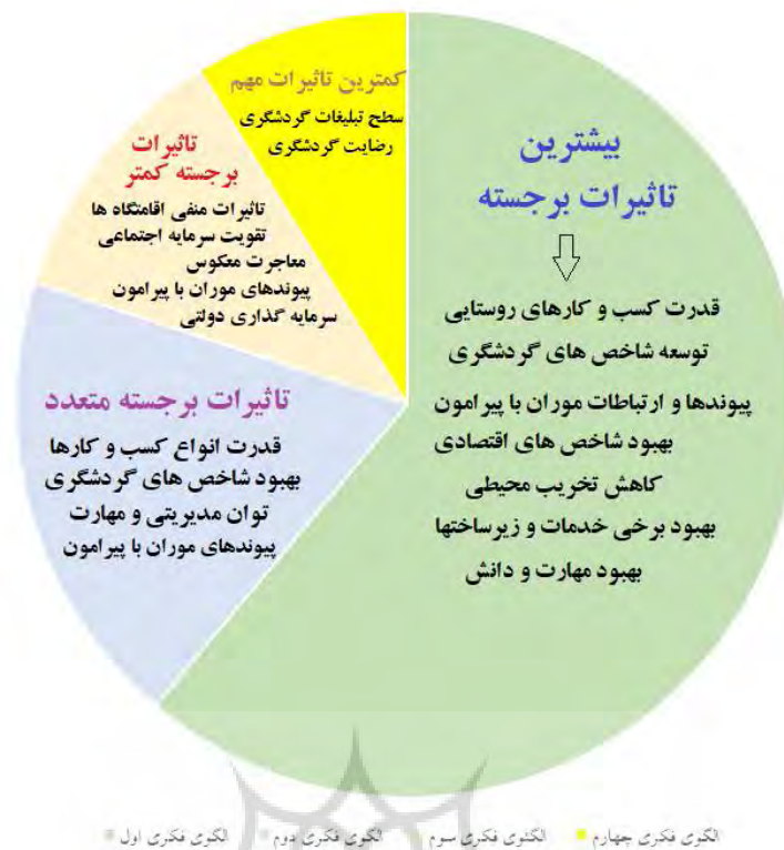
شکل (۳): گراف الگوهای فکری چهارگانه حاکم بر تأثیرات اقامتگاه‌های بوم‌گردی بر توسعه روستایی بخش موران

در بخش مقایسه بین نتایج کار این پژوهش با مطالعات بین‌المللی، نشان می‌دهد که با وجود پرداختن این مطالعات به ابعاد مختلف اقامتگاه و توسعه روستایی کمتر به مسئله تحلیل الگوهای فکری حاکم و نگرش‌ها و دیدگاه‌های مختلف پرداخته شده و از این نظر این پژوهش رویکرد تازه‌ای را به کار گرفته است. در این پژوهش با توجه به نتایج حاصله و شرایط بخش موران و نزدیکی به مناطق مرزی و در نظر گرفتن اصول طراحی اقامتگاه‌ها و کسب و کارها تلاش شده است تا با تبیین ساختار الگوهای ذهنی و فکری، طرز تفکرهای مختلف بین کارشناسان و مردم بومی و محققین را شناسایی کند. در واقع این پژوهش به نوعی می‌تواند تفاوت گروه‌های کارشناسان را از نظر چشم‌انداز اقامتگاه‌های بوم‌گردی مشخص نماید.