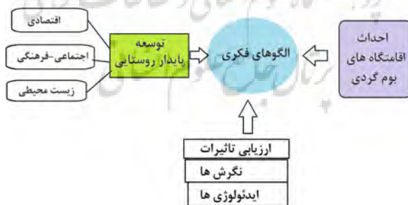
شکل (۱): مدل مفهومی مرتبط

در شکل ۱، براساس مطالعات و یافته‌های میدانی پژوهشگر، مدل مفهومی نشان داده شده است که این مدل ارتباط احداث اقامتگاه‌های بوم‌گردی بر ابعاد اقتصادی، محیط زیستی و اجتماعی- فرهنگی توسعه پایدار روستایی را نشان می‌دهد که متاثر از تفاوت ارزیابی‌ها، نگرش‌ها و ایدئولوژی‌ها، الگوهای فکری مختلف را شکل می‌دهد: