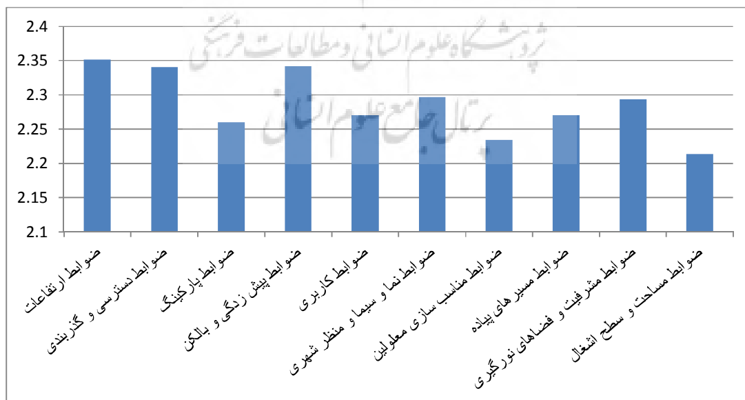
شکل (۴): نمودار مقایسه میزان رضایتمندی شهروندان از اجرای ضوابط و مقررات شهرسازی در منطقه ۸ (منبع: یافته‌های پژوهش)

همان طور که در جدول فوق دیده می‌شود میانگین رضایت شهروندان منطقه هشت در مورد اجرای ضوابط کمتر از ۳ است، همچنین سطح معناداری همه متغیرها کمتر از ۰/۰۵ می‌باشد، بنابراین میانگین متغیرها در منطقه هشت با حد متوسط (۳) اختلاف معنادار دارد و کمتر از حد متوسط است. بیشترین رضایت با میزان ۲,۳۵۱ مربوط به اجرای ضوابط ارتفاعات و کمترین رضایت با میزان ۲,۲۱۳ مربوط به اجرای ضوابط مساحت و سطح اشغال می‌باشد.