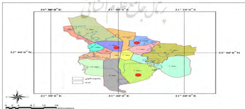
شکل (۲): موقعیت مناطق ۶ و ۸ و ۱۴ شهر اصفهان بازترسیم: نگارندگان

منطقه ۱۴ شهر اصفهان (Isfahan District 14): این منطقه دارای وسعت ۱۹۳۸ هکتار (شامل ۹۹۸ هکتار حریم و ۹۴۰ هکتار محدوده قانونی) در قسمت شمالی شهر اصفهان واقع شده است. از نظر محدوده قانونی از سمت شمال منتهی به جاده تاکسیرانی تا جاده حبیب آباد (ادامه آیت الله غفاری) و از سمت شرق منتهی به امتداد نهر ارزنان تا اتوبان فرودگاه و از سمت جنوب منتهی به محور اتوبان فرودگاه تا میدان لاله و از سمت غرب منتهی به بزرگراه چمران در امتداد خیابان آل بویه (خیابان گلستان) در امتداد خیابان بعثت تا میدان شهدا می‌باشد. براساس سرشماری‌های وزارت کشور جمعیت این منطقه در سال ۱۳۹۵ شامل ۱۶۴۸۵۰ نفر بوده است (آمارنامه شهر اصفهان، ۱۳۹۶).