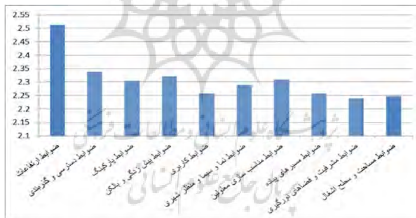
شکل (۵): نمودار مقایسه میزان رضایتمندی شهروندان از اجرای ضوابط و مقررات شهرسازی در منطقه ۱۴

همان طور که در جدول فوق دیده می‌شود میانگین رضایت شهروندان منطقه چهارده در مورد اجرای ضوابط کمتر از ۳ است، همچنین سطح معناداری همه متغیرها کمتر از ۰/۰۵ می‌باشد، بنابراین میانگین متغیرها در منطقه چهارده با حد متوسط (۳) اختلاف معنادار دارد و کمتر از حد متوسط است. بیشترین رضایت با میزان ۲,۵۱۱ مربوط به اجرای ضوابط ارتفاعات و کمترین رضایت با میزان ۲,۲۳۸ مربوط به اجرای ضوابط مشرفیت و فضاهاى نورگیرى می‌باشد.