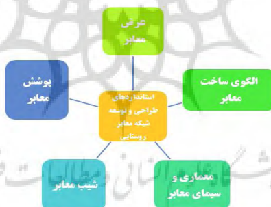
شکل (۱): استانداردهای موثر در طراحی و توسعه شبکه معابر.

شکل شماره (۱) استانداردهای موثر در طراحی و توسعه شبکه معابر در پژوهش حاضر را نشان می‌دهد: