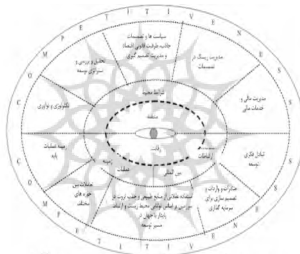
نمودار (۱): مدل رقابت‌پذیری پایدار

با توجه به اینکه اغلب مدل‌ها موضوع پایداری و ظرفیت‌های محدود محیط‌زیست را مد نظر قرار نمی‌دهند، مدل رقابت‌پذیری پایدار در سال ۲۰۰۸ توسط الکساندر ویتوتس ۱ به منظور کاربست راهبرد توسعه پایدار در رقابت‌پذیری مناطق ارائه شده است. در این مدل سه عامل اساسی تعیین‌کننده رقابت پایدار منطقه‌ای است: شرایط محیط: که بیشتر عامل درون منطقه‌ای به شمار می‌رود و شامل عوامل مختلفی نظیر شرایط مالی و خدمات مالی موجود در منطقه، مدیریت منطقه و سیاست‌ها و استراتژی‌ها و سیاست‌های توسعه منطقه می‌شود. ارتباطات بین‌المللی: بیانگر تأثیرات خارج از منطقه بر عوامل درونی منطقه است که مواردی مانند، صادرات و واردات و تبادلات فکری و سرمایه‌گذاری‌های خارجی را شامل می‌شود. زمینه فعالیت: بیانگر ویژگی‌های پایه‌ای منطقه جهت پذیرش رقابت و تعاملات بین حوزه‌های مختلف منطقه است. به طور واضح‌تر وجود زنجیره‌های خدمات یا تولید در منطقه باعث افزایش رقابت‌پذیری در حوزه یک فعالیت خاص در منطقه خواهد شد. در خصوص پایداری، دو بخش ارتباطات بین‌المللی و زمینه عملیات باید به گونه‌ای باشند که توانایی‌های محیط در پذیرش فعالیت‌ها در نظر گرفته شود (Vytautas Rutkauskas, 2008).