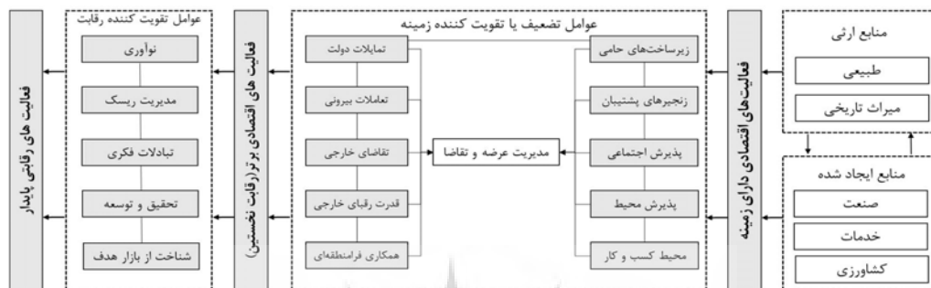
نمودار (۲): چارچوب نظری رقابت‌پذیری پایدار در حوزه‌های مادرشهری

بنا بر اصول تشریح شده می‌توان اصول و مفاهیم مربوط به رقابت‌پذیری پایدار در مناطق مادرشهری را در غالب نمودار زیر خلاصه کرد: