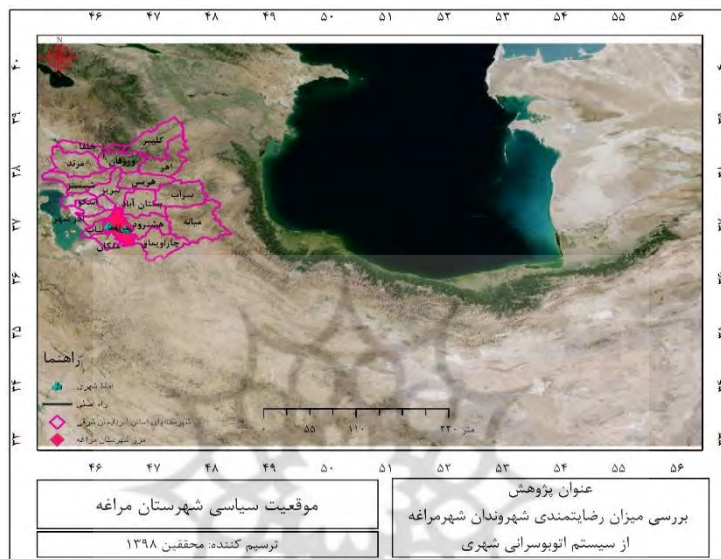
شکل (۲): موقعیت جغرافیایی محدوده مورد مطالعه

مراغه یکی از شهرهای مهم آذربایجان شرقی و مرکز اداری شهرستان مراغه و در فاصله ۱۲۰ کیلومتری تبریز واقع است. این شهر در کنار رودخانه صوفی‌چای و در دامنه جنوبی کوه سهند گسترده شده و در ۳۷ درجه و ۲۳ دقیقه عرض شمالی و ۴۶ درجه و ۱۶ دقیقه طول شمالی واقع گردیده است. این شهر در ۱۳۵ کیلومتری جنوب مرکز استان واقع شده و از سال ۱۳۸۷ خورشیدی، طرح ایجاد منطقه‌ی ویژه اقتصادی به تصویب