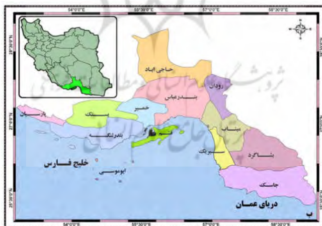
شکل (۳): موقعیت سیاسی شهرستان‌های استان هرمزگان

استان هرمزگان در جنوب کشور و بین مختصات جغرافیایی ۲۵ درجه و ۷ دقیقه تا ۲۸ درجه و ۵۷ دقیقه عرض شمالی و ۵۳ درجه و ۲ دقیقه تا ۵۷ درجه و ۶۶ دقیقه طول شرقی از نصف‌النهار گرینویچ واقع شده است. این استان ۷۲۶۳۱۳۱ کیلومتر مربع مساحت دارد و حدود ۴٫۱ درصد از خاک کشور ایران را تشکیل می‌دهد. هرمزگان از جهت شمال و شمال شرق با استان کرمان، از غرب و شمال غرب با استان‌های فارس و بوشهر، از شرق با سیستان و بلوچستان همسایه بوده و جنوب آن را آب‌های خلیج فارس و دریای عمان در نواری به طول تقریبی ۹۰۰ کیلومتر در بر گرفته است. هرمزگان بر اساس آخرین تقسیمات کشوری در سال ۱۳۹۲ دارای ۱۳ شهرستان، ۳۸ شهر، ۸۵ دهستان، ۳۸ بخش و ۲۲۵۷ آبادی بوده است.