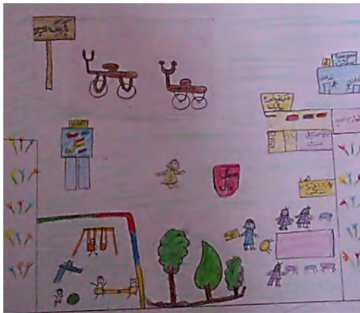
شکل (۷): نقاشی از شهری که کودک می‌خواهد