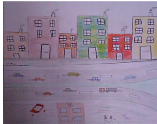
شکل (۶): نقاشی از شهری که کودک در آن زندگی می‌کند

نتیجه آزمون آماری ضریب همبستگی پیرسون در جدول زیر نشان می‌دهد که بین همه متغیرهای شهر دوستدار کودک رابطه معنی داری وجود دارد. به همین جهت دستیابی به شهر دوستدار کودک در اردبیل مستلزم دید کلی در رابطه با فضاها و عناصر شهری می‌باشد. کودکان به وجود پارک و بازار در شهر علاقمندند و کمبود آن‌ها را در شهر بیشتر احساس می‌کنند به گونه‌ای که رابطه همبسته آن‌ها در آزمون پیرسون ۰.۳۴ صدم و با سطح اطمینان ۹۹ درصد و سطح خطای یک درصد به دست آمد.