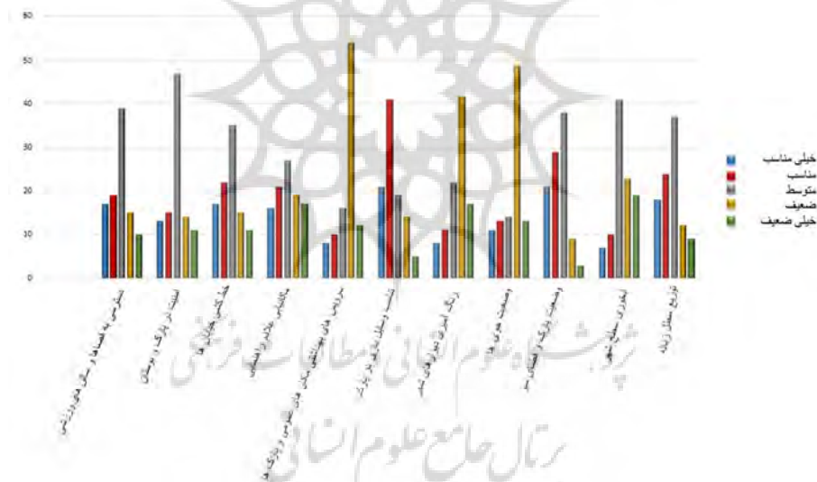
نمودار (۵): وضعیت شهر از نگاه کودکان شهر اردبیل

در این مرحله، شهر اردبیل از نگاه کودکان اردبیلی مورد بررسی قرار گرفته تا میزان رضایت کودکان از شهر و امکانات آن معلوم شود. در این رابطه باید گفت که ۷۱ درصد کودکان دوست داشتند که در مدرسه خود سطل‌های جداگانه زباله وجود داشته باشد تا تفکیک زباله در شهر و محله آنها صورت بگیرد که یکی از دلایل آن را اتمام مدرسه و عدم استفاده از دفترها و گاه‌گاه کتابها می‌دانستند علاوه بر این ۶۲ درصد کودکان از صدای بوق