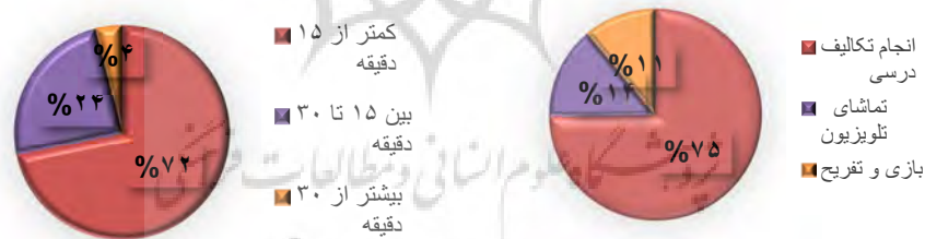
نمودار (۲): زمان اختصاص داده شده به فعالیت

بر اساس آنچه از پرسشنامه کودکان در رابطه فعالیت آن‌ها استنباط می‌شود این است که ۵۷ درصد فعالیت کودکان مربوط به انجام تکالیف درسی، ۱۷ درصد بازی و تفریح، ۱۴ درصد به تماشای تلویزیون و درصد کمی فعالیت‌های خرید مشغول