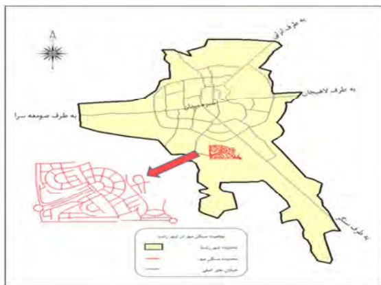
شکل (۱): نقشه‌ی مسکن مهر رشت

پس از آن به استخراج شاخص‌های کالبدی-فضایی، عملکردی - ساختاری، اجتماعی- فرهنگی، اقتصادی و محیط مسکونی؛ جهت سنجش میزان رضایتمندی ساکنان مسکن مهر پرداخته شده است. از نظر زمانی این پژوهش در بهار ۱۳۹۴ انجام شده است. روایی پرسشنامه با استفاده از نظر استاد محترم راهنما و متخصصین تأیید و اصلاح گردید. در بررسی پایایی پرسشنامه از روش آلفای کرونباخ استفاده شده است. جامعه آماری در این پژوهش، ساکنان مجتمع ۱۸۰۰۰ واحدی مسکن مهر شهر رشت می‌باشد که در حال حاضر تعداد شش هزار و هشتصد خانوار در آن ساکن شده‌اند. با استفاده از فرمول تعیین نمونه کوکران، حجم نمونه به دست آمده، ۳۸۱ نفر برآورد شد. در پرسشنامه موردنظر به شیوه تصادفی ساده به نسبت جمعیت بلوک‌های متفاوت مسکن مهر توزیع گردید. در این پرسشنامه سنجش میزان رضایتمندی از طرح مسکن مهر با توجه به ۵ شاخص مذکور بوده که برای دقت بیشتر هر کدام از این شاخص‌ها به زیر شاخص‌های جزئی‌تری تقسیم گردید؛ که ارزش‌گذاری این متغیرها با استفاده از طیف لیکرت (۱-خیلی کم، ۲-کم، ۳-متوسط، ۴-زیاد، ۵-خیلی زیاد) صورت پذیرفته است. تجزیه و تحلیل داده‌ها نیز با استفاده از نرم افزار SPSS انجام شد. جهت بررسی فرضیه‌های پژوهش، تحلیل سوالات و بررسی تفاوت معنی‌داری بین پاسخ‌دهندگان در هر یک از سوالات از آزمون خی دو ( \chi^2 ) و آزمون تی (T) و برای گروه‌بندی سوالات از روش تحلیل خوشه‌ای سلسله‌مراتبی استفاده شده است.