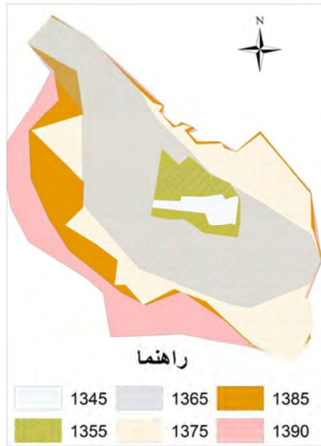
شکل (۳): رشد کالبدی فضایی شهر یاسوج (۱۳۹۰-۱۳۴۵)