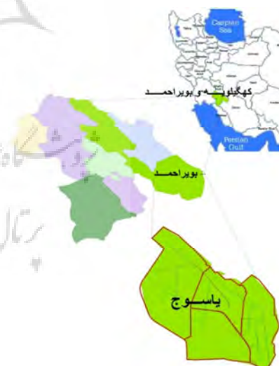
شکل (۱): موقعیت شهر یاسوج در استان و کشور ترسیم کننده: نگارندگان

شهر یاسوج در مختصات جغرافیایی ۵۱ درجه و ۲۱ دقیقه تا ۵۱ درجه و ۴۳ دقیقه طول شرقی از نصف النهار گرینویچ و ۳۰ درجه و ۲۸ دقیقه تا ۳۰ درجه و ۴۷ دقیقه عرض شمالی از استوا قرار گرفته است. موقع خصوصی شهر یاسوج در قسمت برآفتاب سررود در بویراحمد علیا و در نقطه تقارن و همگرایی دو رودخانه بشار در جنوب و مهران در غرب و کوه دنا در شمال و شمال شرقی محصور شده است. پیرامون موقع نسبی، این شهر از شمال به ارتفاعات زاگرس، از طرف جنوب به کریم آباد، خلف آباد، نجف آباد، از طرف مشرق به محمود آباد علیا و از طرف شمال غربی و مغرب به مهران، شرف آباد وسطی، شرف آباد سفلی و بلکو محدود می‌شود (نوروزپور، ۱۳۹۲: ۴۶).