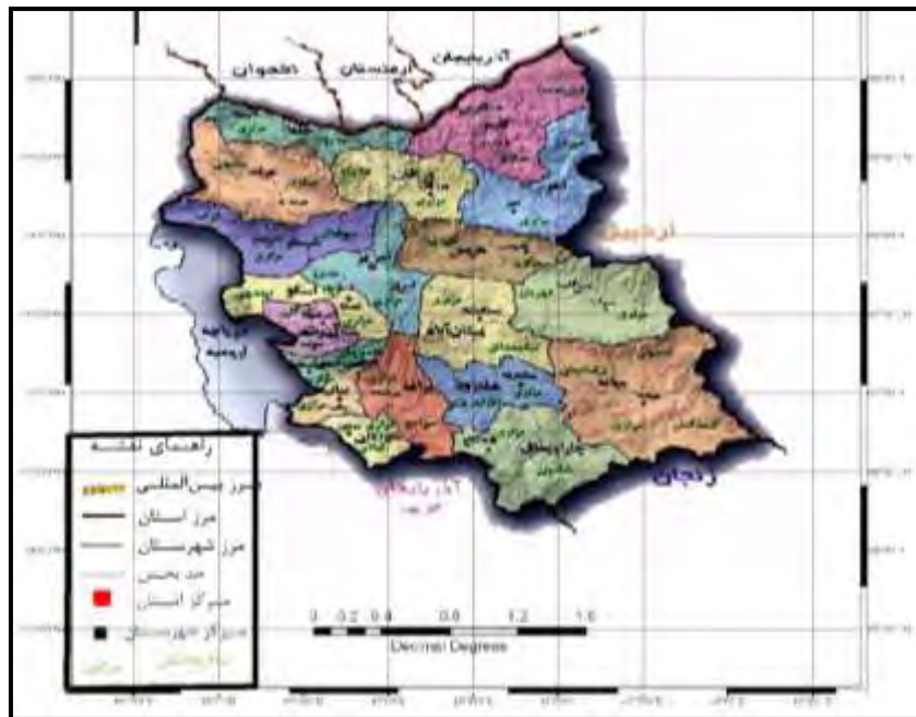
نقشه (۱): موقعیت جغرافیایی و تقسیمات جغرافیایی شهرستان‌های استان آذربایجان شرقی