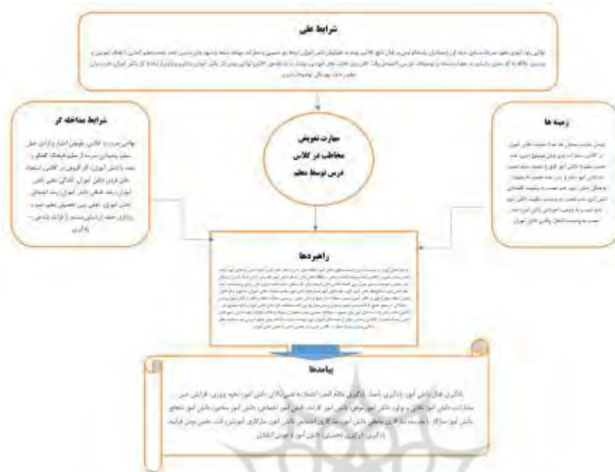
مدل (۲): مدل تدوین شده مهارت تعویض مخاطب در کلاس درس