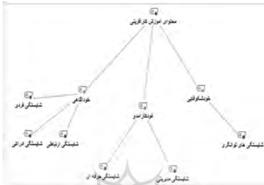
شبکه مضامین محتوای آموزش کارآفرینی با نرم‌افزار مکس کیودا