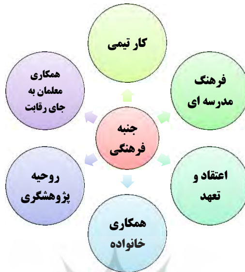
نمودار (۳): زیرمقوله‌های استخراج شده از جنبه فرهنگی

در مقایسه با ژاپن، نظام آموزشی ایران و آموزش در مدرسه تأکید زیادی بر ظرفیت فردی با توجه به موضوع بهبود کیفیت دارد. تمرین‌های آموزشی در ایران باید به سمت نظام یادگیری مشارکتی بیشتر که شامل یادگیری متقابل و تدریس تیمی است، هدایت شود. بین فرهنگ مدرسه در ژاپن و ایران تفاوت وجود دارد. طراحان آموزشی ایران نیاز به بررسی مجدد دارند تا بتوانند فاصله بین نظریه و عمل را محدود کنند و یک محیط دموکراتیک و مبتنی بر روابط انسانی در مدرسه ایجاد کنند. براساس نتایج تحقیق (Sarkararani, 2006)، معلمان ایرانی باید مهارت‌های تشریک‌مساعی جهت تصمیم‌گیری تعاملی در مدارس را فرا بگیرند. آن‌ها همچنین نیاز دارند تا اهمیت فرایند تصمیم‌گیری به‌عنوان نقش مهم در فعالیت‌های آموزشی مدارس را درک کنند. معلمان ایرانی و مدیران آموزشی باید درک و نگرش خودشان را درباره بهبود کیفی معلم توسعه دهند. بهبود کیفیت تدریس نباید محدود به ارتقاء مهارت‌های انفرادی یاددهی- یادگیری معلمان باشد. تأکید باید بر روی جایگاه کار مشارکتی در بین گروه باشد. همچنین نتایج پژوهش (SarkarArani and Fukaya, 2010) نشان داد که تأکید بیشتر بر ظرفیت‌های انفرادی به‌جای توان گروهی و توجه به موضوع بهبود کیفیت آموزش و پرورش مدارس یکی از چالش‌هایی است که درس پژوهی در اجرا با آن مواجه است.