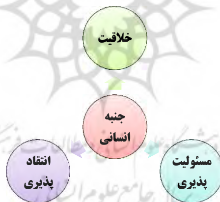
نمودار (۲): زیرمقاله‌های استخراج شده از جنبه انسانی

بعد از مصاحبه با خبرگان آگاه و تجزیه و تحلیل مصاحبه‌ها، مفاهیمی درباره جنبه انسانی استخراج شد که شامل ۳ زیرمقاله جنبه انسانی است که در نمودار زیر نشان داده‌اند.