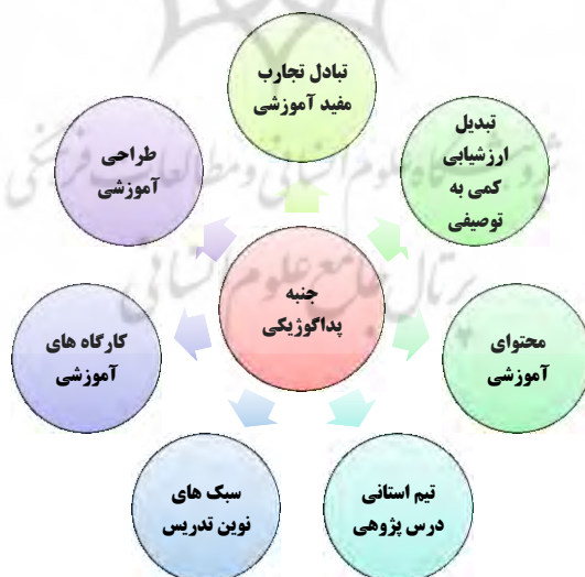
نمودار (۶): زیرمقوله‌های استخراج شده از جنبه پداگوژیکی

تبادل تجارب مفید آموزشی: مصاحبه‌شونده‌ای در خصوص تأثیر تبادل تجارب مفید آموزشی در کاربرد درس پژوهی بیان می‌کند: «معلمان به‌جای مشارکت به دنبال رقابت هستند و همین موضوع سبب می‌شود که آن‌ها کار خود را در اختیار سایر معلمان قرار ندهند». مصاحبه‌شونده دیگری در خصوص تبادل تجارب مفید آموزشی به‌عنوان یکی از شاخص‌های جنبه مدیریتی می‌گوید: «درس پژوهی باید از رقابت خارج شود و هدف درس پژوهی اصلاً رقابت نیست، از وقتی که درس پژوهی در استان به‌صورت رقابت درآمد، تیم‌ها از در اختیار قرار دادن نتایج کار خود به تیم‌های دیگر امتناع می‌کنند». بعد از مصاحبه با خبرگان آگاه و تجزیه و تحلیل مصاحبه‌ها، مفاهیمی درباره جنبه پداگوژیکی استخراج شد که شامل ۷ زیرمقوله است که در نمودار زیر نشان داده‌اند.