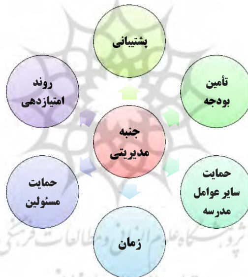
نمودار (۵): زیرمقوله‌های استخراج شده از جنبه مدیریتی

بعد از مصاحبه با خبرگان آگاه و تجزیه و تحلیل مصاحبه‌ها، مفاهیمی درباره جنبه مدیریتی استخراج شد که شامل ۶ زیرمقوله است که در نمودار زیر نشان داده‌اند.