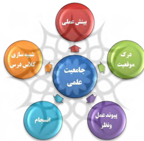
نمودار (۴): زیرمؤلفه‌های استخراج شده از جامعیت علمی

مفاهیمی که از مصاحبه با اساتید در ارتباط با جامعیت علمی استخراج شدند شامل ۵ زیر مؤلفه می‌باشند؛ که در نمودار زیر نمایش داده شده‌اند.