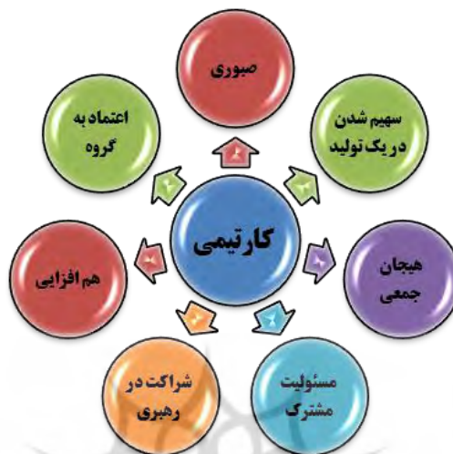
نمودار (۲): زیرمؤلفه‌های استخراج شده از کار تیمی

بعد از مصاحبه با اساتید و تجزیه و تحلیل مصاحبه‌ها، مفاهیمی درباره کار تیمی استخراج شد که شامل ۷ زیر مؤلفه کد مفهومی کار تیمی می‌باشند که در نمودار زیر نشان داده‌اند.