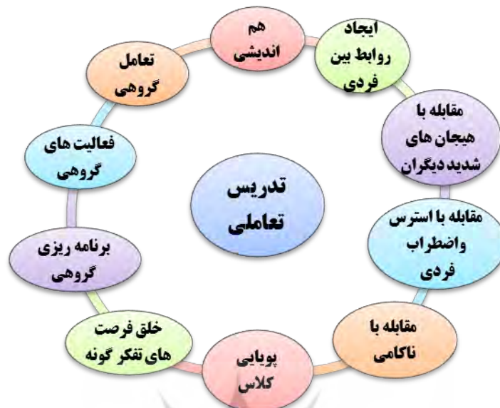
نمودار (۳): زیرمؤلفه‌های استخراج شده از تدریس تعاملی

درس پژوهی تمرین آمادگی برای دستیابی به بهترین روش تدریس است که توسط فعالیت‌های گروهی در جلسات درس پژوهی سازمان داده می‌شود (Sarkararani, 2011: 35). این فرایند رویکردی داوطلبانه در گروه‌های معلمان است که با هدف بهبود سبک تدریس انجام می‌گیرد (Eisuke, 2012: 181). این شیوه، ایده‌ای جهانی برای بهسازی و پویایی آموزش و غنی‌سازی یادگیری است و همگان را به هم‌اندیشی تشویق می‌کند و می‌تواند به تغییرات مثبتی برای مقابله با استرس و اضطراب منجر شود. به زبان ساده می‌توان درس پژوهی را مشاهده کلاس توسط همکاران و نقد آن تعبیر کرد. این روش زمانی مؤثر است که منجر به اصلاح طرح درس و خلق ایده‌ای نو و فرصت‌های تفکرگونه برای تدریس شود. البته این نکته قابل توجه است که درس پژوهی واقعی در کلاس درس و با مخاطب دانش‌آموز شکل می‌گیرد. به‌زعم بختیاری تدریس پژوهی صحیح‌تر از درس پژوهی است؛ زیرا در زمان انجام آن، معلم به فکر بهبود و اصلاح تدریس و معلمی خود و تعامل با دانش‌آموزان است. حتماً در تدریس پژوهی، معلم هم رشد می‌کند و یاد می‌گیرد و به رشد حرفه‌ای همکارانش نیز کمک می‌کند (Bagheri, 2016: 36). بنابراین درس پژوهی، الگویی اثربخش برای اندیشه، عمل و پژوهش و پویایی در نحوه طراحی و سازماندهی گفت‌وگو و تعامل در کلاس است (Sarkararani, 2011) همچنین مدلی اثربخش برای خلق محیطی شوق‌انگیز برای یادگیری برنامه‌های درسی است (Bahrami Hidji & Morsali, 2012). بنابراین با استفاده از تدریس تعاملی استاد با دانشجویان در کلاس درس دانشگاه می‌توان دانشجویان را به هم‌اندیشی و تعامل گروهی تشویق کرد. فضای پویایی را در کلاس ایجاد کرده و تا با استفاده از روابط بین‌فردی مثبت و مقابله