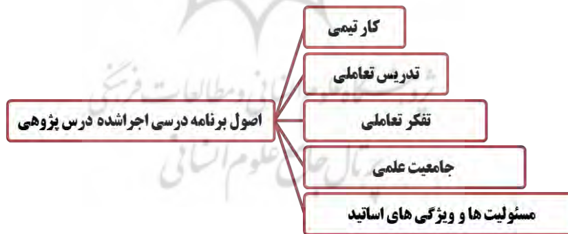
نمودار (۱): اصول برنامه درسی اجرا شده درس پژوهی

با انجام این پژوهش ۲۴۵ کد مفهومی به دست آمد که کدهای مربوط به اصول حاکم بر اجرای موفق درس پژوهی از آن‌ها استخراج شدند. این مفاهیم ۵ مؤلفه اصلی هستند که شامل: کار تیمی، تدریس تعاملی، تفکر تعاملی، جامعیت علمی، مسئولیت‌ها و ویژگی‌های اساتید بوده و این مؤلفه‌های اصلی به ۳۶ زیر مؤلفه طبقه‌بندی شده‌اند. نمودار زیر اصول حاکم بر اجرای مطلوب برنامه درسی درس پژوهی را به وضوح نشان می‌دهد.