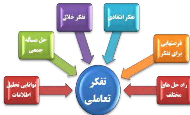
نمودار (۴): زیر مؤلفه‌های استخراج شده از تفکر تعاملی