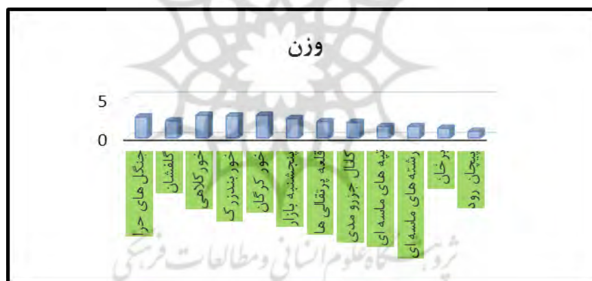
شکل ۳- نمودار معیار علمی ژئومورفوسایت‌های دشت میناب با استفاده از مدل رینارد