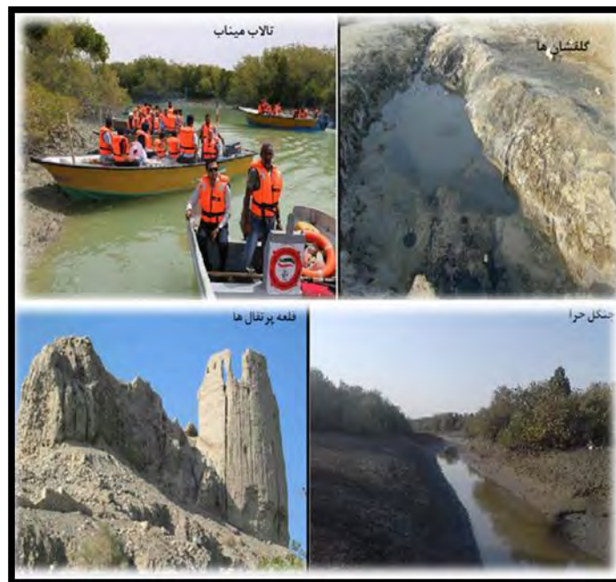
شکل ۲- عکس‌هایی از ژئومورفوسایت‌های انتخابی شهرستان میناب

برای ارزیابی برخی معیارهای علمی و مکمل همانند در دسترس بودن، بکر بودن، قابلیت مشاهده و ...، مشاهدات ارزیاب (در اینجا نگارندگان)، از طریق نرم افزار GIS، نقشه و مشاهدات میدانی متقن است و نیازی به کارشناس و نظری خواهی دیگران ندارد. اما برای برخی از معیارهای ژئومورفوسایت‌ها همچون محافظت، مدیریت و زیبایی‌شناسی باید از نظر کارشناسان متخصص و مدیر که به منطقه آشنایی کامل دارند استفاده شود. برای این منظور جامعه آماری این پژوهش از کارشناسان، مدیران، صاحب‌نظران و خبرگان عرصه گردشگری انتخاب شده‌اند که با حضور در محل کار به صورت حضوری و یا غیر حضوری و تلفنی از ایشان مصاحبه صورت گرفته است. ۳ نفر از اساتید عرصه گردشگری دانشگاه هرمزگان، ۷ نفر از مدیران و کارشناسان اداره کل استان و اداره شهرستان میناب و ۵ نفر از خبرگان و علاقمندان به طبیعت انتخاب شده و در پاره ای از معیارها نظرخواهی شده است. نمره کل معیار با توجه به پاسخ نظر سنجی لحاظ شده است. عوارض ژئومورفولوژیک منطقه مورد مطالعه در (جدول ۸) لیست شده است.