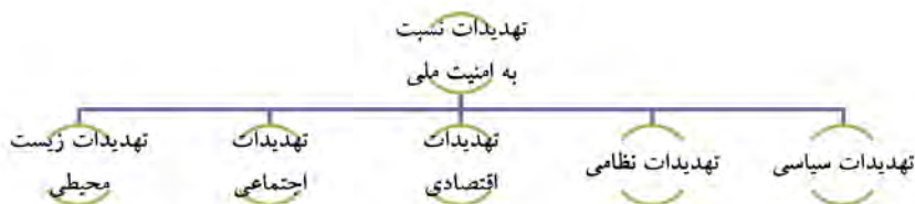
شکل ۳- تهدیدات علیه امنیت ملی (رحیمی، ۱۳۹۷: ۳۶)

باری بوزان تهدیدات امنیتی را در پنج بعد مورد بررسی قرار داده است. این ابعاد عبارتند از: