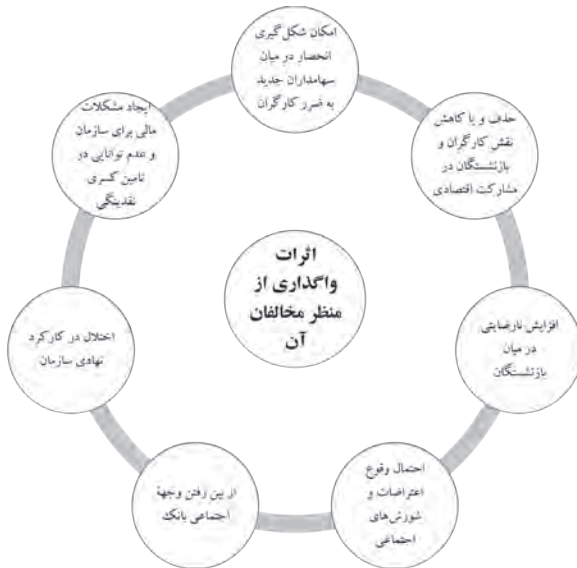
شکل ۴. اثرات واگذاری از منظر مخالفان آن