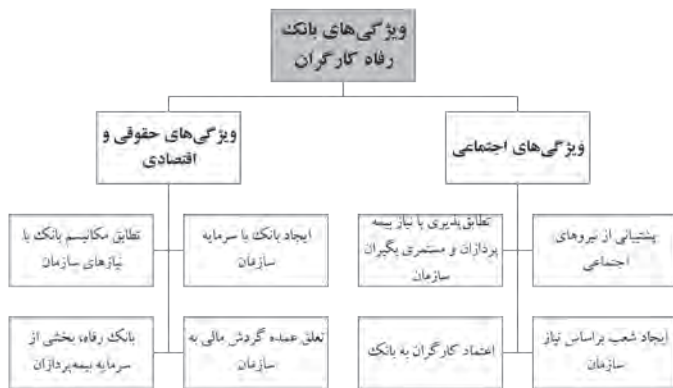
شکل ۱. گروه‌های موافق و مخالف طرح واگذاری

نقدینگی با این روش قابل پوشش نبوده است، بحث اخذ تسهیلات مالی از بانک مطرح شده است. در حقیقت بانک رفاه کارگران این وظیفه را یافته است که شکاف بین منابع و مصارف ماهیانه سازمان را پر کند و این مهم‌ترین وظیفه‌ای است که امروزه بر دوش بانک رفاه کارگران قرار گرفته است.