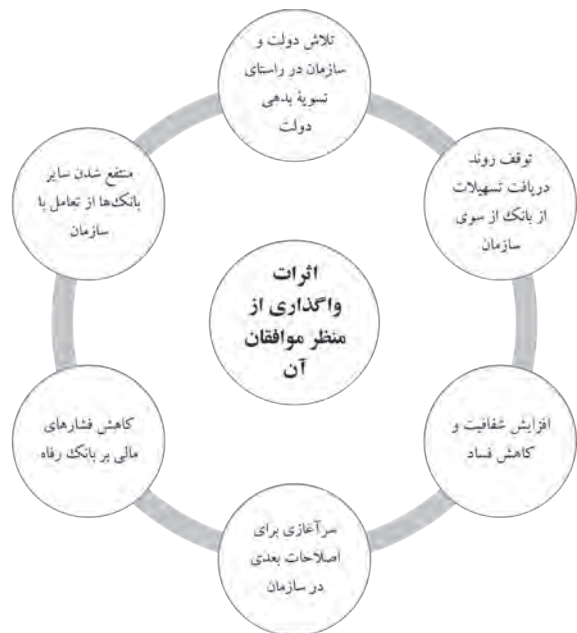
شکل ۵. اثرات واگذاری از منظر موافقان آن