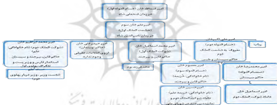
شکل شماره (۱): دودمان خزیمه علم ۳ از زمان فتحعلی‌شاه تا انقراض.