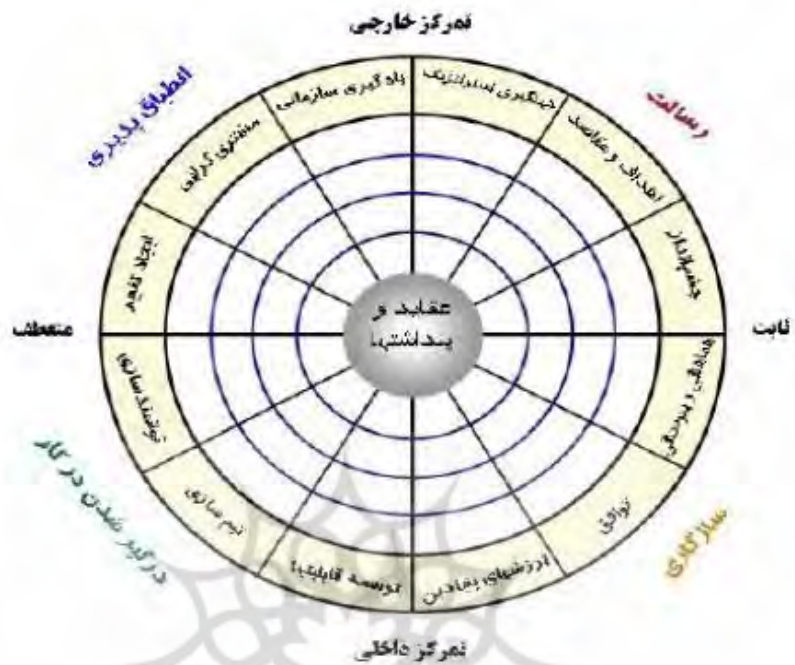
شکل (۱): ابعاد فرهنگ سازمانی منبع: (Denison, 2000) به نقل از ابراهیم پور و همکاران، (۲۰۱۱)