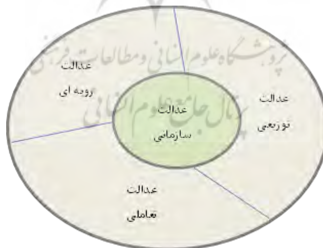
شکل (۲): ابعاد عدالت سازمانی