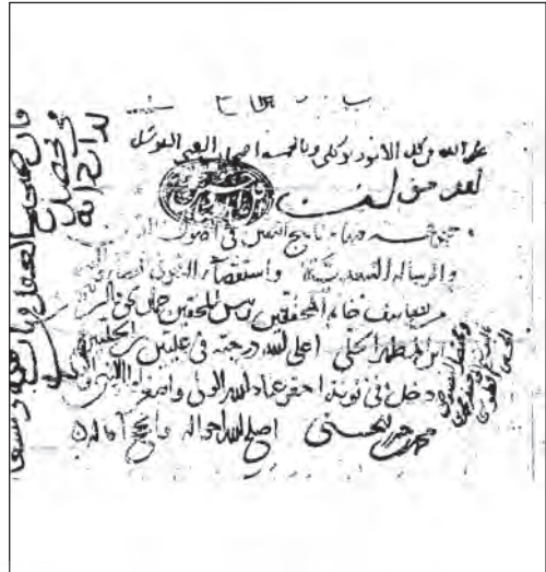
تصویر شماره ۱: صفحه عنوان مجموعه خطی با میکروفیلم شماره ۲/۲۶۲۶۹ در کتابخانه آستان قدس رضوی.