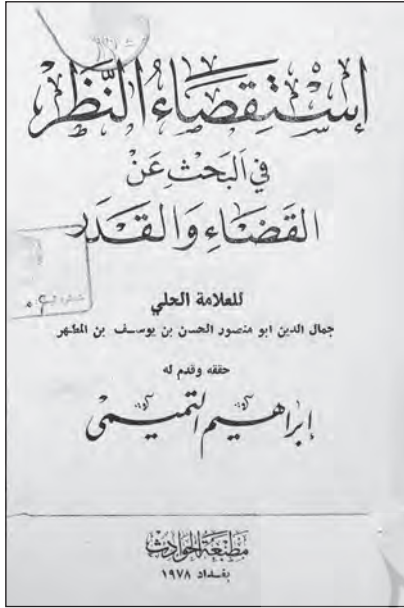
تصویر شماره ۵