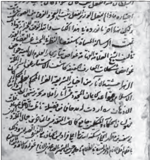
تصویر شماره ۳: انجامه نسخه ۳۵/۱۰۱۱۵ کتابخانه مجلس شورای اسلامی از استقصاء التَّنظُر

پژوهشگاه علوم انسانی و مطالعات فرهنگی کتابخانه آستان قدس رضوی