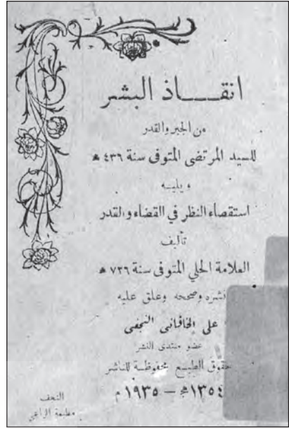
تصویر شماره ۴