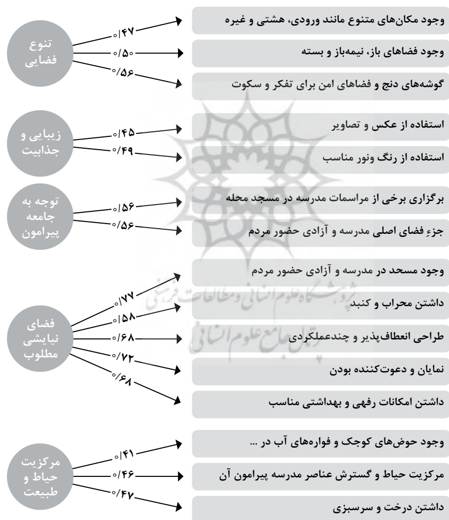
شکل ۳. ویژگی‌های محیط کالبدی مدارس و بار عاملی آن‌ها

همان طور که در جدول شماره ۲ مشاهده همه شاخص‌ها در وضعیت قابل قبول و مود تأیید است. مقدار X^2/df برابر با ۲/۱۷ در دامنه مطلوب قرار دارد همچنین RMSEA نیز برابر با ۰/۵ و در دامنه مطلوب هست. همچنین شاخص‌های دیگر مثل PNNFI، NNFI، AGFI، IFI همگی در دامنه مطلوب قرار گرفتند. CFI نیز برابر با ۰/۹۸ و قابل قبول می‌باشد. در بررسی معناداری بارهای عاملی نیز همان طور که در شکل ۳ مشاهده می‌شود بار عاملی همه بالاتر از ۰/۴ و معنادار می‌باشد.