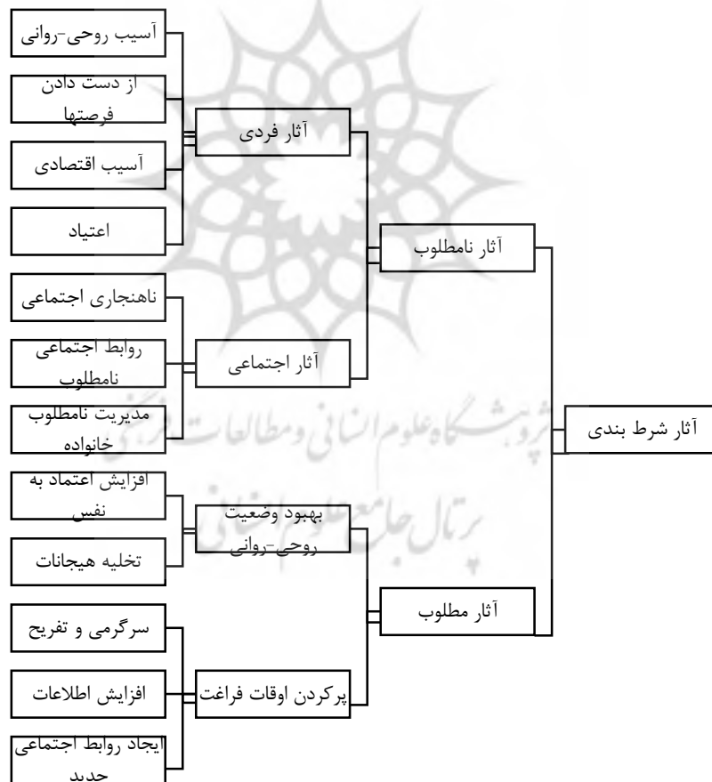
شکل ۱. نقشه تماتیک مربوط به آثار شرط‌بندی در ورزش

برخی از برنامه‌های ورزشی را به عنوان یک محرک برای شرکت در شرط‌بندی عنوان کردند. مشارکت کنندگان نقش شبکه‌های اجتماعی را به خاطر تبلیغات گسترده پررنگ دانسته و بیان داشتند که بیشتر افراد به واسطه این شبکه‌های جذب سایت‌های شرط‌بندی می‌شوند. در نهایت مشارکت کنندگان در پاسخ به این سوال که تفاوت بین شرط‌بندی و مسابقات پیش‌بینی چیست بیان کردند که تفاوت اصلی در پرداخت پول و مساله حرام بودن می‌باشد. در ادامه نقشه تماتیک هر یک از ابعاد تحقیق که در قالب سوالات نیمه‌ساختاریافته، مطرح و مورد بررسی قرار گرفتند، ارائه شده است. نقشه تماتیک شماره (۱) مربوط به آثار شرط‌بندی در افراد جامعه است.