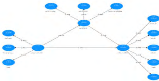
شکل ۲. مدل اندازه‌گیری پژوهش در حالت تخمین ضرایب