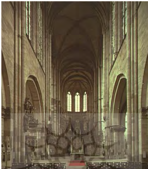
تصویر ۱ - فضای داخلی کلیسای جامع سنت موریتیوس (Saint Maurice Cathedral) در ماگدبورگ (Magdeburg)، آلمان. توجه کنید به مزار ایستر در گوشه پایین سمت چپ تصویر (Brockett, ۲۰۱۲: ۳۱).

این در حالی است که تمامیت زیبایی‌شناسی و کلیت هنر در قرون وسطی، وابسته به یک مفهوم کلی بود. مفهومی که تقریباً تمام فرقه‌های این عصر به حضور آن در آثار هنری تأکید داشتند. "حداقل توقعی که می‌توان از اثر هنری [در قرون وسطی] داشت کاربردی بودن آن است" (کوماراسوامی، ۱۳۹۳: ۵۵). در همین راستا آگوستین قدیس می‌گوید: "تو استعداد را آفریدی تا صنعتگر، هنر خود را به آن عرضه کند، و در درون خود ببیند آنچه را که باید در برون بسازد" (همان: ۶۸). فلسفه اواخر قرون وسطی، مفهومی را شکل می‌دهد که در آن، همه چیز، در هر زمان، نمود و مظهری از وجود خداوندی است. این امر را می‌توان به‌وضوح در مفهوم حضور فراگیر الهیات پان‌برگ نیز مشاهده کرد که به‌شکلی مشابه مفهوم جاودانگی و به‌موازات آن بسط می‌یابد.