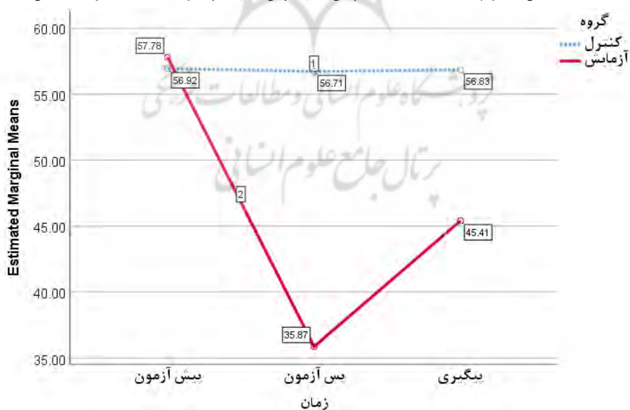
نگاره ۲. مقایسه میانگین اضطراب پنهان در سه حالت پیش آزمون، پس آزمون و پیگیری به تفکیک گروه آزمایش و کنترل