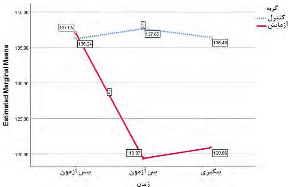
نگاره ۳. مقایسه میانگین فشار خون در سه حالت پیش آزمون، پس آزمون و پیگیری به تفکیک گروه آزمایش و کنترل

به عملکردی دشوار پیدا می‌کند. اما انسان قادر است تا بر اضطراب کاملاً تسلط داشته باشد و آن را تحت کنترل درآورد به نحوی که بتواند با آن روبرو شده و بر تجربیات ایجاد کننده اضطراب چیره گردد (قضاوی، رحیمی، اسفندیاری، شاکریان، ۱۳۹۷). هدف ابتدایی رفتار درمانی مبتنی بر پذیرش آماده کردن بیماران با آموزش تکنیک‌های مراقبه به منظور پرورش و رشد کیفیت ذهن آگاهی می‌باشد. بنابراین، تمرکز اصلی رفتار درمانی مبتنی بر پذیرش آموزش تکنیک‌های مراقبه مختلف به شرکت کنندگان است که به گسترش ذهن آگاهی منجر می‌شود. اگر چه این تکنیک‌های ذهن آگاهی مختلف تا حدی در روش با هم متفاوتند، اما آنها هدف مشابهی در آگاه‌تر شدن از افکار و احساسات و تغییر دادن ارتباطشان با آنها دارند. مراقبه ذهن آگاهی به منظور گسترش این دیدگاه بکار برده می‌شود که افکار و احساسات را بعنوان اتفاقات ذهنی و نه بعنوان جنبه‌هایی از خود یا بازتاب درستی از واقعیت در نظر بگیرند. در اوایل رفتار درمانی مبتنی بر پذیرش توسط کابات - زین به صورت گسترده‌ای برنامه‌های مراقبه ذهن آگاهی را ارزیابی و ساختار یافته کرد. رفتار درمانی مبتنی بر پذیرش با استفاده از تکنیک‌های مراقبه درون‌بینی بودایی ابتدا در حوزه‌های پزشکی رشد کرد و در ادامه به حوزه‌های عمومی و روانشناختی کشیده شد (کابات - زین، ۲۰۰۵). در فرآیند درمان تعهد و پذیرش، انعطاف‌پذیری روانشناختی به عنوان اساس سلامت روانشناختی شناخته می‌گردد. فرآیند درمان