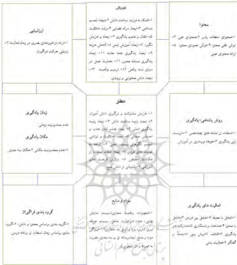
شکل شماره ۲: الگوی برنامه درسی مبتنی بر واقعیت مجازی در درس علوم

با توجه به نتایج حاصل از سنتز پژوهی و کدگذاری باز و محوری، به طور کلی الگوی برنامه درسی مبتنی بر واقعیت در درس علوم دوره ششم ابتدایی به صورت زیر می باشد: