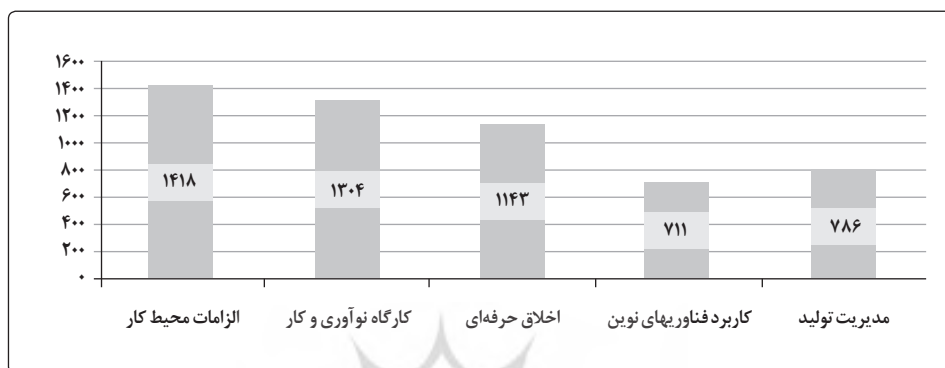
نمودار ۱. میزان کل فراوانی توجه به مؤلفه‌های تربیت حرفه‌ای در کتابهای درسی دوره دوم متوسطه فنی و کار دانش

براساس جدول شماره ۲، مجموع فراوانی مؤلفه‌های مفهومی تحلیل شده در کتابهای شایستگیهای غیرفنی ۵۳۵۵ مورد است که از میان شاخصهای تربیتی تحلیل شده بیشترین توجه به مؤلفه دانش کسب کار با ۱۹۲۳ فراوانی و ۳۵/۹۱ درصد بوده و کمترین توجه به نگرش اقتصادی با ۱۶۵۴ فراوانی و ۳۰/۸۸ درصد بوده است. توضیحات بیشتر در نمودار ۱ آمده است.