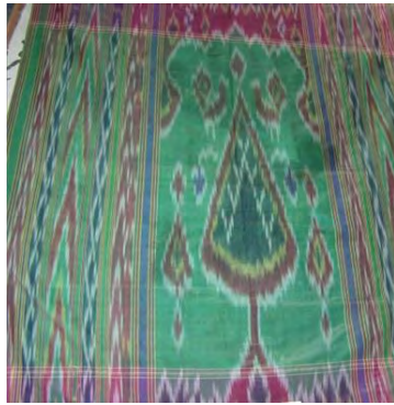
تصویر ۲- نقش سرو با طاووس در دارایی

سرو و طاووس: از جمله نقوشی هستند که در هنر ایرانی به خصوص نساجی سنتی از جایگاه ویژه ای برخوردارند، زیرا این نقوش در طول تاریخ هنر ایران زمین همواره حضور داشته و با گذشت زمان در صفحات تاریخ محو نگردیده اند. نقش سرو نماد درخت زندگی است به واسطه همیشه سبز بودن و طاووس محافظ آن و نشانه‌ای است از آسمان پر ستاره و شاید کاربرد این نقش نسبت به پرندگان دیگر به همین منظور باشد، دقت و ظرافت بی نظیر در شکل دادن به این نقوش در پارچه‌های دارایی نیاز به مهارتی بسیار زیاد دارد.