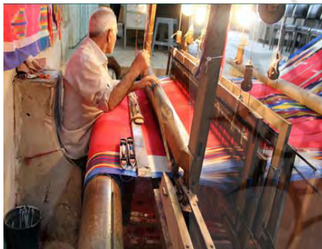
تصویر ۱- دارایی بافی در یزد

بافتندگی و بافت پارچه‌های مختلف برای پوشاک و مصارف دیگر یکی از شغل‌های مهم مردمان یزد در طول تاریخ این شهر بوده است. مردم یزد از گذشته که دستگاه‌های دستی وجود داشته تا به امروز که دستگاه‌های سنتی و دستی جای خود را به دستگاه‌های ماشینی داده اند با زیبایی هرچه تمام تر پارچه‌هایی را خلق کردند که از نظر فرم و شکل و رنگ منحصر به فرد بوده است. (سلیمی ندوشن، ۱۳۸۰: ۱۰۱)