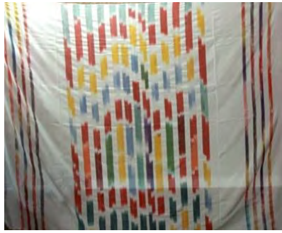
تصویر ۵: نقش ابروباد

ابر: از نظر نمادین وجوه مختلفی را در بر می گیرد که اصلی ترین آن ها در ارتباط با طبیعت مخلوط و غیر مشخص آن است ابر را وسیله ای به جامع در آمدن و مظهریت نیز داشته اند. در عرفان لاسلامی ابر (العماء) مرحله ی ماهوی و غیر قابل شناخت از (الله) قبل از ظهور است. در چین باستان، ابرهای سفید و رنگین که قربانیان رستگار فرود می آورند و قبور جاودانگان راه که سوار بر ابرها در آسمان می رانند، بالا می بردند ابرها وابسته به نماد آب هستند و در نتیجه وابسته به نماد باروری است. (کیمیایی اسدی، ۱۳۸۷: ۱۶۰)