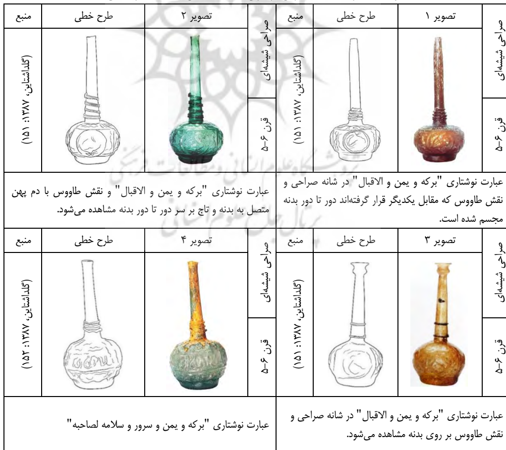
جدول ۱- آثار شیشه‌ای ایران در قرن‌های ۷-۳ ه.ق

از میان ۷۲۵ اثر شیشه‌ای متعلق به سرزمین‌های ایران و مصر طی قرون ۷-۳ ه.ق، در این بخش ۲۸ اثر شیشه‌ای مزین شده با عناصر نوشتاری مورد بررسی قرار گرفته است. جدول ۱ در بر دارنده ۱۲ اثر شیشه‌ای ایران و جدول ۲ شامل ۱۶ نمونه آثار شیشه‌ای مصر است.