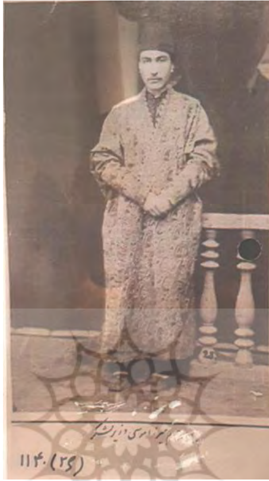
میرزا موسی وزیر لشکر

پرونده شماره ۱۱۴۰ (۲۵) پژوهشگاه علوم انسانی و مطالعات فرهنگی پرتال جامع علوم انسانی