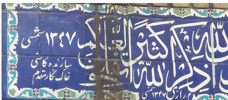
کتیبه مسجد میرزا موسی م. رازی ۱۳۴۷ شمسی، سازنده کاشی خاک نگار مقدم