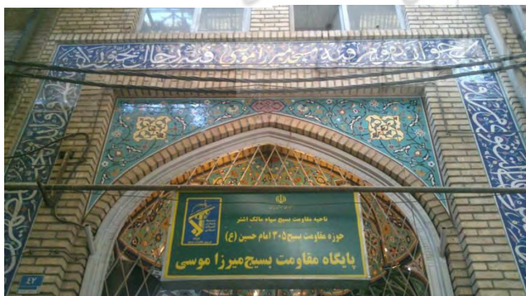
سر در مسجد میرزا موسی

از تاریخ‌های مختلف کتیبه‌های مسجد دانسته می‌شود که مسجد در دوره قاجار احداث شده و در دوره پهلوی و انقلاب اسلامی بازسازی و تعمیر شده است.