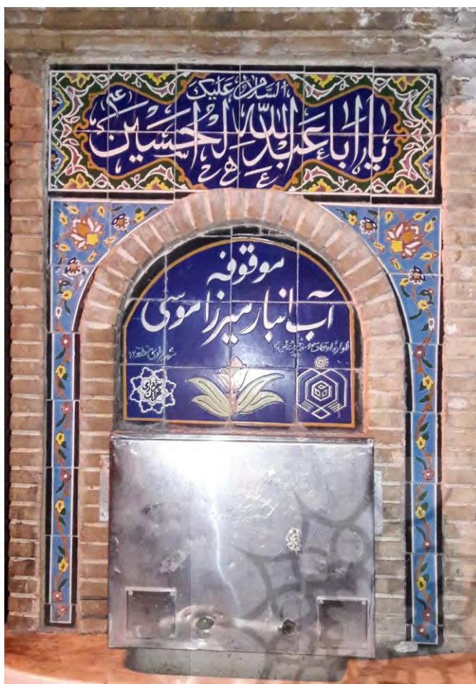
موقوفه آب انبار میرزا موسی وزیر بازار تهران، سبزه میدان، ۱۳۹۷ شمسی