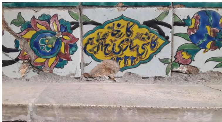
کتیبه مسجد میرزا موسی کارخانه کاشی سازی ح آ ابراهیم ۱۳۲۲