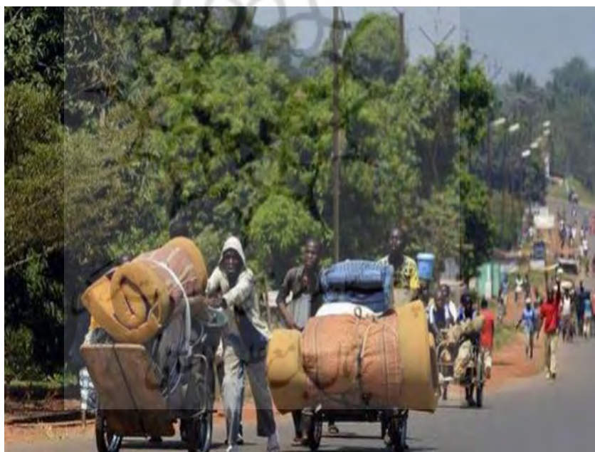
عکس شماره ۴: فقر

توصیف: این تصویر را می‌توان توسط خطی که از گوشه بالایی سمت راست به گوشه پایینی سمت چپ وصل می‌شود به دو مثلث تقسیم کرد. در مثلث بالایی تعداد زیاد و درهم‌تنیده درختان سرسبز را می‌بینیم که ارتفاع بلندی دارند و برگ‌هایشان همچون برگهای درختان مناطق استوایی است. در