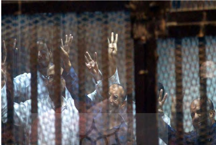
عکس شماره ۳: ناتوانی از ایجاد دموکراسی

توصیف: هر دو این تصاویر آرشیوی هستند و برای این خبر «انتخاب» شده‌اند. در تصویر اول فضای تصویر بالتساوی میان محمد مرسی رییس جمهور مخلوع مصر (سمت چپ)، و یکی از اعضای ارشد گروه اخوان المسلمین تقسیم شده است. در بخش پیش‌زمینه تصویر هفت خط عمودی به رنگ مشکی تصویر افراد پس‌زمینه را قطع کرده است. در پس‌زمینه تصویر چهره دو فرد که یکی از دیگری شناخته‌شده‌تر است و در ماه‌های منتهی به خبر بیشتر در رسانه‌ها دیده شده است دیده می‌شوند. دستان هر دو فرد بر روی زانوان و در هم‌فشرده و حالت چهره حالتی در حال انتظار را نشان می‌دهد. لباس هر دو نفر یک تی‌شرت سفیدرنگ یکدست و در تفاوت تام با لباس‌هایی که پیش از این با آن در رسانه‌ها نمایان شده بودند است. ترکیب‌بندی تصویر متقارن است و میان توده تصویری در دو سمت چپ و راست و توده تصویری در بالا و پایین تعادل و برابری وجود دارد. عداد رنگ‌های موجود در تصویر محدود است و عمدتاً می‌توان فضا را مایه خاکستری معرفی کرد. در تصویر دوم که مربوط به تعدادی از رهبران اخوان المسلمین در مصر است، همان خط‌های عمودی تصویر بالا وجود دارد. میان این خط‌های عمودی بافتی مشبک دیده می‌شود. مجموع این خطوط و این توری فلزی مشبک فضای زندان و قفس را به ذهن متبادر می‌کند. افراد موجود در تصویر اول در این تصویر تکثیر شده‌اند. سر پنج نفر در این تصویر دیده می‌شود ولی تعداد دست‌ها و رنگ‌های آستین آنها نشان می‌دهد که تعداد افراد بیش از پنج نفر است. همه این افراد دست‌هایشان را بالا گرفته و سه انگشت خود را به سمتی در کنار دوربین نشان داده‌اند. این علامت سه انگشت نشانه