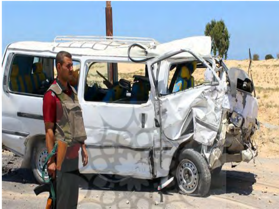
عکس شماره ۱: تروریسم

توصیف: در این تصویر یک خودرو ون (که با توجه به تعداد صندلی‌ها امکان جایابی حدود ده نفر را دارد) سفیدرنگ به تصویر کشیده شده است. روی خودرو هیچ نشانی از دستگاه‌های دولتی و یا سازمان‌های بین‌المللی مانند سازمان ملل و ... وجود ندارد. نیمه جلویی خودرو و نیز درب جلویی سمت کنار راننده در تصویر دیده می‌شود که تخریب شده است. استیک جلویی نیز پنجر است. پس زمینه تصویر سه درخت و خاکی زرد رنگ را نشان می‌دهد که شباهت به ویژگی‌های جغرافیایی صحرا دارد. در جلوی صحنه سرباز و یا فرد مسلحی ایستاده است که زاویه نگاهش نه به سمت دوربین بلکه به سمت خارج از کادر تصویر است. لباس این فرد لباسی غیر نظامی همراه با جلیقه‌ای نظامی است. زمان تصویربرداری روز و به نظر می‌رسد از ساعات پرنور روز است (چشم‌های بهم فشرده شده از نور فرد مسلح این مساله را به ذهن متبادر می‌نماید). سنگریزه‌هایی کف خیابان وجود دارد. رنگ‌های موجود در تصویر رنگ‌های زندگی روزمره و نور آن نور مایه روشن و طبیعی مربوط به روز است.