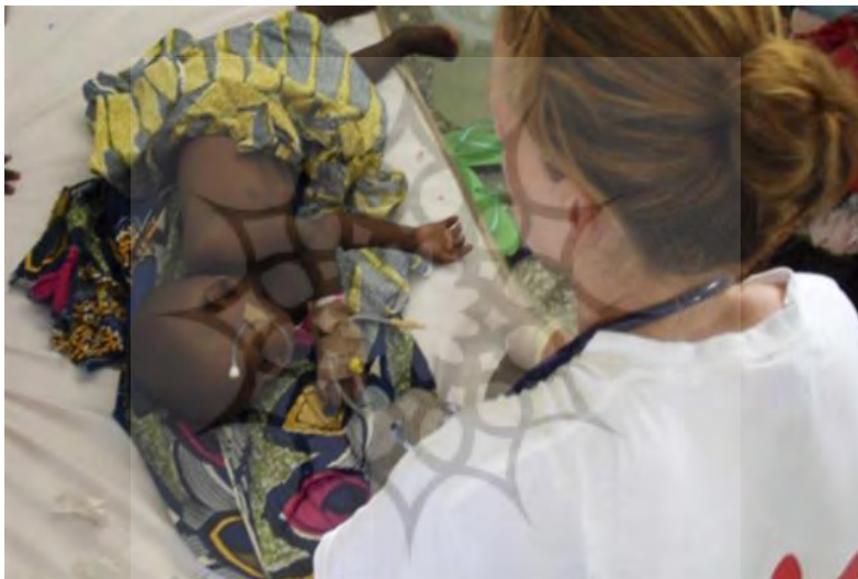
عکس شماره ۶: اسطوره سفید

توصیف: این تصویر را می‌توان توسط خطی که از گوشه بالا سمت راست به گوشه پایین سمت چپ ختم می‌شود به دو مثلث تقسیم کرد. در مثلث سمت راست یک زن پشت به دوربین و در حال نظاره نیمه دوم تصویر است. این زن لباس سفید به تن دارد و بندی به گردن وی دیده می‌شود که در کنار لباس سفید گوشی استتوسکوپ پزشکی را به ذهن متبادر می‌نماید. پوست زن سفیدرنگ است. پ‌شت لباس زن نوشته یا علامتی به رنگ قرمز دیده می‌شود که چون همه بدن زن در درون قاب قرار نگرفته است نمی‌توان تشخیص داد این نوشته چیست. در نیمه دوم تصویر، کودکی حدوداً دو-سه ساله بر روی پارچه‌ای رنگی و شبیه به رنگ آمیزی لباس‌ها و پارچه‌های سنتی رنگارنگ منطقه آفریقا خوابیده است. کودک به پهلو خوابیده و روی دست چپش سرم و انژوکت دیده می‌-