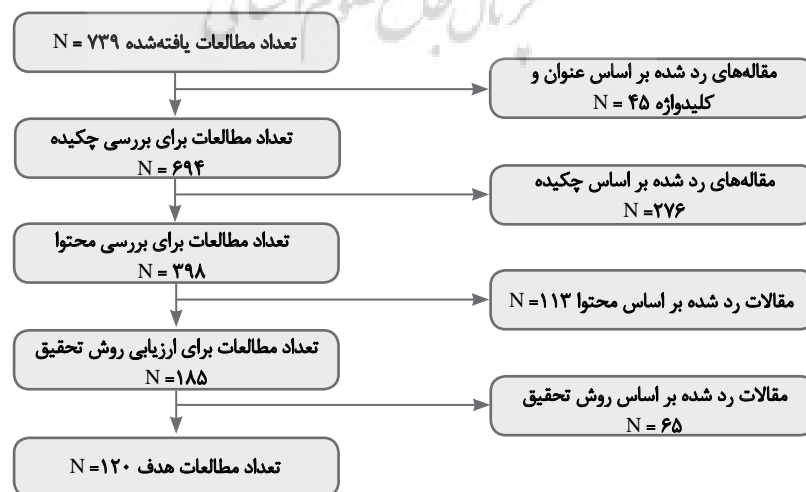
تصویر ۱. فرآیند بررسی مقالات.

بر اساس تجزیه و تحلیل و تلفیق مطالعات عوامل مؤثر بر بین‌المللی‌سازی کسب‌وکارهای کوچک و متوسط روستایی، ۲۴ مفهوم شناسایی شدند که در ۷ زمینه اصلی طبقه‌بندی شدند. از ۱۷ مفهوم، ۱۰ مفهوم در ۵ زمینه اصلی عوامل داخلی سازمان؛