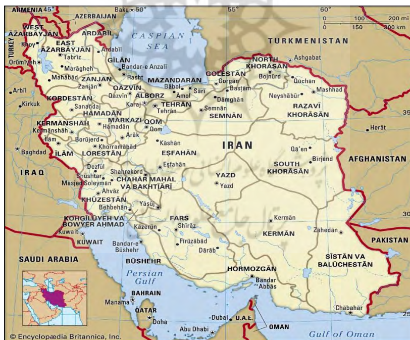
نقشه ۲: مرزهای ایران

ایران ۲۱ پایانه مرزی مسافری و ۵۰ پایانه مرزی کالا با همسایگان دارد: تعداد پایانه‌های مرزی ایران از ۹ پایانه در سال ۱۳۵۷، با ۲۴ مورد افزایش، به ۳۳ پایانه مرزی مجهز در سال ۱۳۸۷ ارتقاء یافت. میزان صادرات از بازارچه‌های مرزی ۲۴۵/۶۲ میلیون دلار بوده است در حالی که ۵۰ درصد از بازارچه‌های مرزی کشور سهمی در صادرات ندارند. از میزان صادرات بازارچه‌های مرزی به لحاظ ارزشی در هشت‌ماهه سال جاری بازارچه‌های زیر صادرات داشته‌اند.