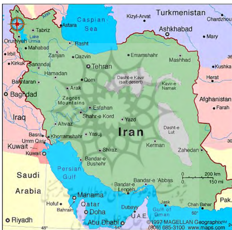
نقشه ۱: موقعیت ایران در منطقه

گمرک عبارت است از سازمان دولتی که مسئول اجرای قوانین گمرکی و اخذ حقوق و عوارض ورودی (واردات) و خروجی (صادرات) و همچنین مسئول اجرای سایر قوانین و مقررات مربوط به واردات، ترانزیت و صادرات کالاها است. اجرای قوانین و مقررات مربوط به کالای همراه مسافر نیز بر عهده سازمان گمرک است.