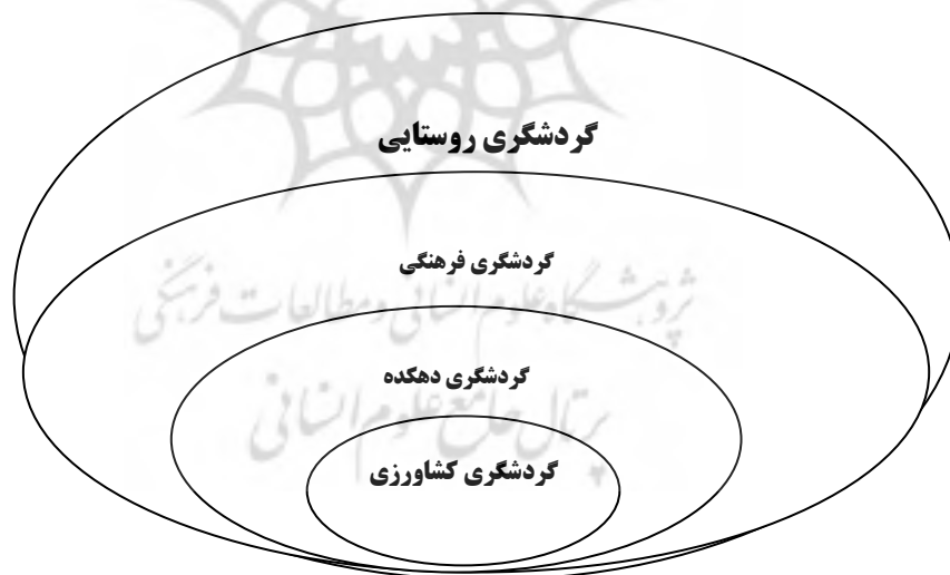
شکل ۱- Inference from Petrovic. et. al. 2017

گردشگری روستایی تنها گردشگری وابسته به مزرعه نیست بلکه فعالیت هایی نظیر گردشگری طبیعی (اکوتوریسم)، پیاده روی، کوه نوردی، اسب سواری، گردشگری ماجراجویانه، گردشگری ورزشی، گردشگری سلامت، شکار، ماهیگیری، گردشگری آموزشی، فرهنگی، تاریخی و در برخی روستاها گردشگری قومی و نژاد شناسی را نیز در بر می گیرد. (Wang, 2017. Verma, 2018)