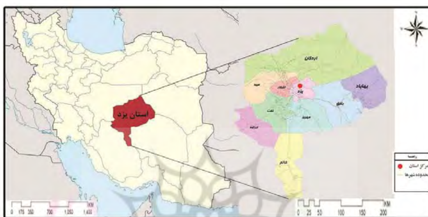
شکل ۲: نقشه موقعیت جغرافیایی شهرستانهای استان یزد