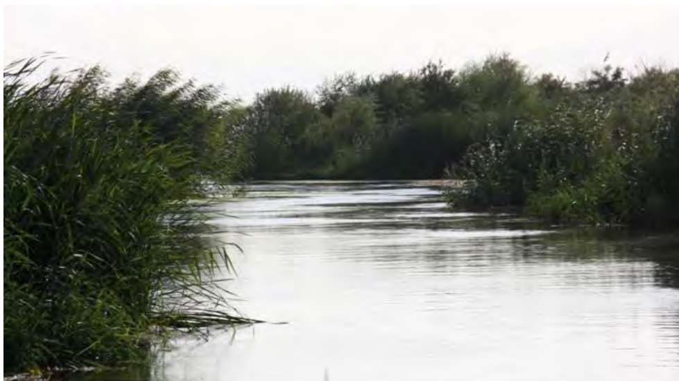
شکل (۱) جاذبه های طبیعی گردشگری منطقه مورد مطالعه

اندازه‌ای بی‌بدیل و چشم‌نواز، سال‌ها به خاطر مقررات خاص تردد در نواحی مرزی از دسترس همگان دورنگه داشته شده بود که باعث مسئولین برای گردشگران بازگشایی شد.