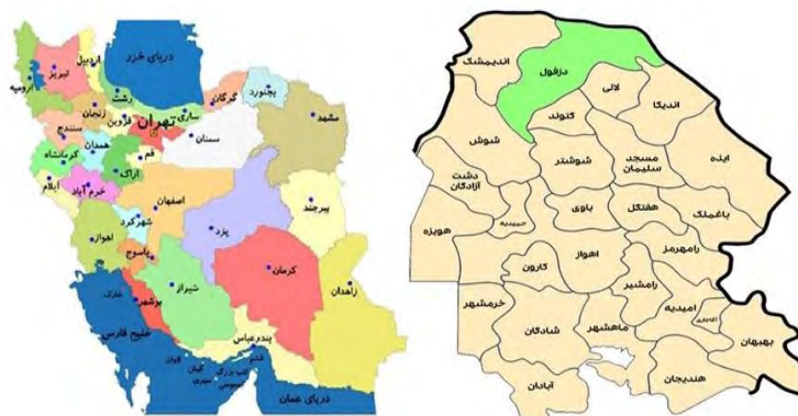
شکل شماره ۱. موقعیت جغرافیایی شهرستان بیرجند

محدوده مورد مطالعه شهرستان دزفول می‌باشد. این شهرستان از شهرستان‌های استان خوزستان در جنوب غربی ایران است. که با مساحت ۴۷۶۲ کیلومتر مربع بین ۴۸ درجه و ۲۰ دقیقه تا ۴۸ درجه و ۳۱ دقیقه طول شرقی از نصف النهار گرینویچ قرار گرفته است و بین ۳۲ درجه و ۷۵ دقیقه عرض شمالی از خط استوا قرار گرفته است. این شهرستان از شمال به استان لرستان، از غرب به شهرستان اندیمشک از شرق به استان‌های چهار محال بختیاری از جنوب شرقی به شهرستان مسجد سلیمان و از جنوب به شهرستان‌های شوشتر و گتوند و از جنوب غربی به شهرستان شوش محدود می‌شود. جمعیت شهرستان دزفول با روندی رو به افزایش بر اساس آخرین سرشماری ۵۰۰۰۰۰ نفر، سی‌مین شهرستان پرجمعیت کشور و دومین شهرستان پرجمعیت خوزستان می‌باشد (آمارنامه شهرداری دزفول، ۱۳۹۵). که از ظرفیت تمام کافه‌های دزفول جهت انجام تحقیق استفاده شده است