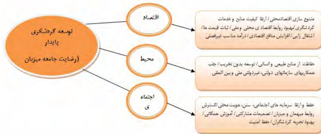
شکل شماره ۲. مدل توسعه گردشگری پایدار