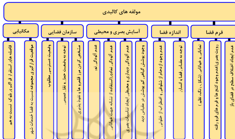
نمودار ۲- معیارهای کالبدی موثر بر ایجاد امنیت در فضای باز مجتمع های مسکونی

بازرسی های صورت گرفته در روند مبانی نظری می توان به دسته بندی مؤلفه های کالبدی موثر بر ایجاد امنیت در فضاهای باز مجتمع های مسکونی در نمودار ۲ اشاره نمود.