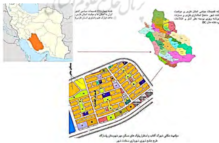
تصویر ۱- موقعیت جغرافیایی محدوده مورد مطالعه، منبع: نگارندگان

مسکن مهر شهرستان پاسارگاد در سه نوع مخاطب مسکن کارگری، مسکن فرهنگیان و مسکن کمیته امداد در شرق شهر سعادت شهر ۲ کیلومتری جاده سعادت شهر_ ارسنجان در شهرک جدیدی به مساحت ۶۰ هکتار با کاربری های پیشنهادی، مسکونی، تجاری، اداری، ورزشی، فضای سبز، فرهنگی، بهداشتی، آموزشی و... واقع شده است که در حال حاضر صرفا آپارتمان های مسکن مهر کارگری و مسکن مهر فرهنگیان اجرا شده است.