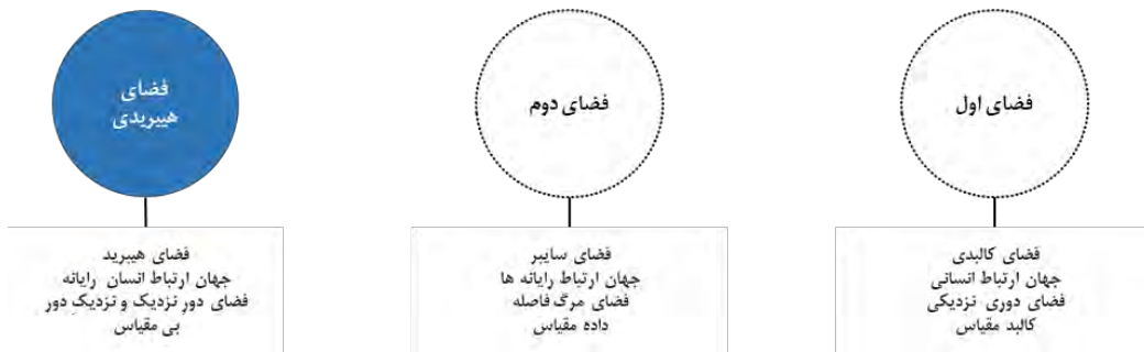
دیاگرام ۴- تعامل دو فضای موازی و شکل‌گیری فضای هیبریدی

است که روابط اجتماعی را در سطح کلان و روابط خرد را در سطح «خود و دیگری» در بستر «فضای هیبریدی» دگرگون کرده است. این تحول حاصل وضعیتی است که صنعت ارتباطات به طور عام برای تحقق شکل سرعت یافته‌های از حرکت جمعیت، ارتباطات بین فردی و نزدیک شدن فضاها فراهم آورده است. این روند در دو فضا و بر مبنای «واقعیت‌های همزمان» بسیاری در جهان معاصر شکل گرفته و به شکل گسترده‌های تحقق یافته است. دوفضایی شدن مباحثی چون فرهنگ، دولت، هویت و شهر نموده‌های عینی این تحول بزرگ می‌باشند (عاملی، ۱۳۸۴). این منظومه شهری از طریق ارتباطات از راه دور، اینترنت و سیستم‌های حمل و نقل سریع به هم دوخته شده و امکان تمرکز و عدم تمرکز همزمان را فراهم می‌آورد و نوع جدیدی از جغرافیای شبکه‌ها و گره‌های شهری را در جهان، کشورها و مناطق ایجاد می‌کند که در این حالت ارتباطات اجتماعی به طور همزمان هم فردی است و هم گروهی، هم مکانی است و هم جریانی (کاستلز، ۲۰۰۴).