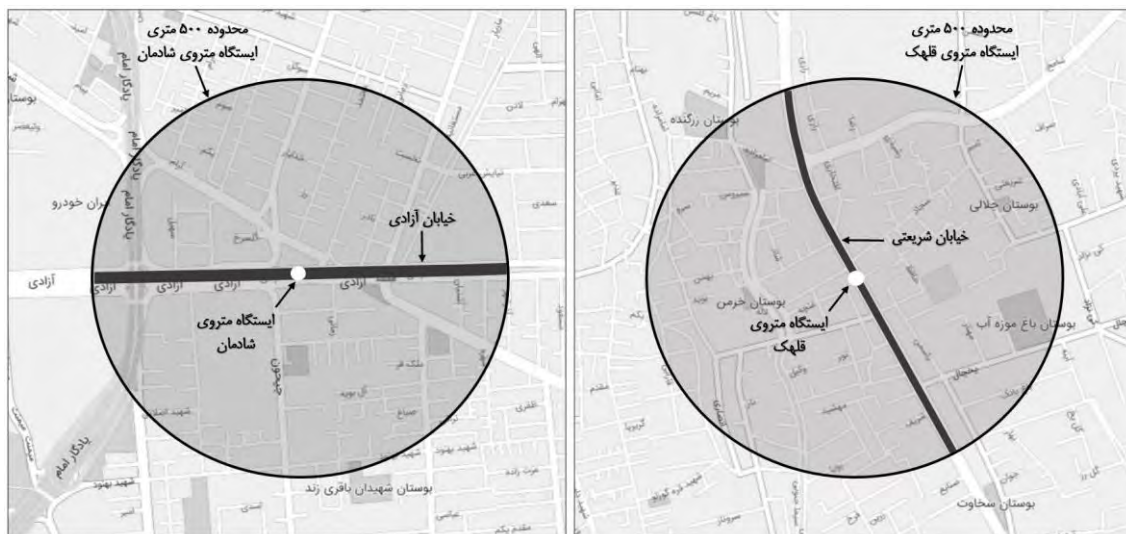
شکل ۲. محدوده مکانی پژوهش

ویژگی دوم، سابقه سکونت پرسش‌شوندگان است. در این پژوهش افرادی بررسی شدند که از پیش از زمان بهره‌برداری از ایستگاه مترو تا زمان انجام پژوهش در محدوده مدنظر ساکن بوده‌اند تا بتوان روایی پاسخ‌های ایشان را استناد کرد که احراز این ویژگی با سؤال از پرسش‌شوندگان پیش از تکمیل پرسشنامه صورت گرفته است. همچنین به‌منظور تعیین حجم نمونه منتخب از جامعه آماری مورد نظر، از فرمول کوکران ۱ استفاده شد.