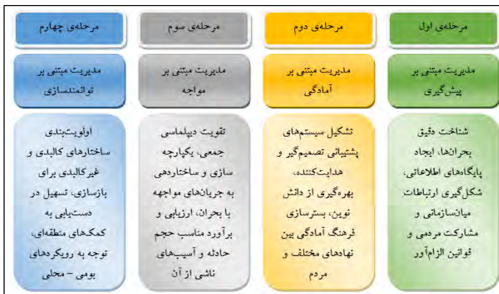
شکل ۳- الگوی مدیریت بحران شهر اردبیل بر اساس الزامات پدافند غیرعامل. (Research findings, 2019).

مقایسه‌ی اهداف و نتایج تحقیق حاضر نیز با مطالعات و پژوهش‌های پیشین حاکی از اختلاف بسیار بین آنها می‌باشد. چنانچه اکثر مطالعات و پژوهش‌های پیشین در شکل کالبدی و همچنین سازگاری و استاندارد جانمایی کاربری‌های حیاتی و نقش مدیریت بحران در پایش این موارد و جلوگیری از خسارات در زمان وقوع بلایای طبیعی و مصنوع انجام گرفته‌اند. در حالی که به‌منظور مدیریت بحران شهرهای امروزی نیاز به پیش‌نیازهای اساسی در ابعاد مختلف پیشگیری، آمادگی، مواجهه و بازسازی احساس می‌گردد که پژوهش حاضر به دنبال پر کردن خلأ پژوهشی موجود بوده است. از طرفی نتایج برخی مطالعات و پژوهش‌ها نیز حاکی از اشتراکاتی با تحقیق حاضر بوده است که از آن جمله می‌توان به تأثیر مشارکت جامعه‌ی مدنی در تحقق مدیریت بحران شهری در پژوهش میچل و همکاران (۲۰۱۰)، تأکید بر هماهنگی و یکپارچگی در پژوهش مدیری و همکاران (۱۳۹۴)، و آموزش و پژوهش مناسب در راستای شناخت بحران‌ها، ایجاد ارتباطات میان‌سازمانی به‌منظور مشارکت حداکثری سازمان‌های مرتبط در فاز پیشگیری و سرمایه‌گذاری بر روی ساختارهای اطلاعاتی و ارتباطاتی در پژوهش کاملی‌فر (۱۳۹۷) اشاره کرد. با توجه به نتایج مستخرج از پژوهش حاضر به‌منظور بهبود وضعیت موجود علاوه بر تقویت مؤلفه‌های موردبررسی، راهکارهای زیر ارائه می‌گردد: